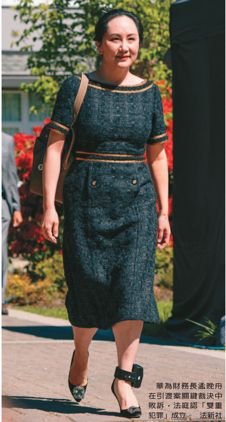
華為財務長孟晚舟在引渡案關鍵裁決中敗訴，法庭認「雙重犯罪」成立。

【記者胡玉立／綜合報導】加拿大卑詩省最高法院27日裁決華為科技公司財務長孟晚舟引渡案涉及的犯行，符合雙重犯罪標準；被軟禁在溫哥華自宅長達18個月的孟晚舟，重獲自由希望破滅；此案引渡美國程序將繼續進行，下一階段聽證會訂6月15日舉行。