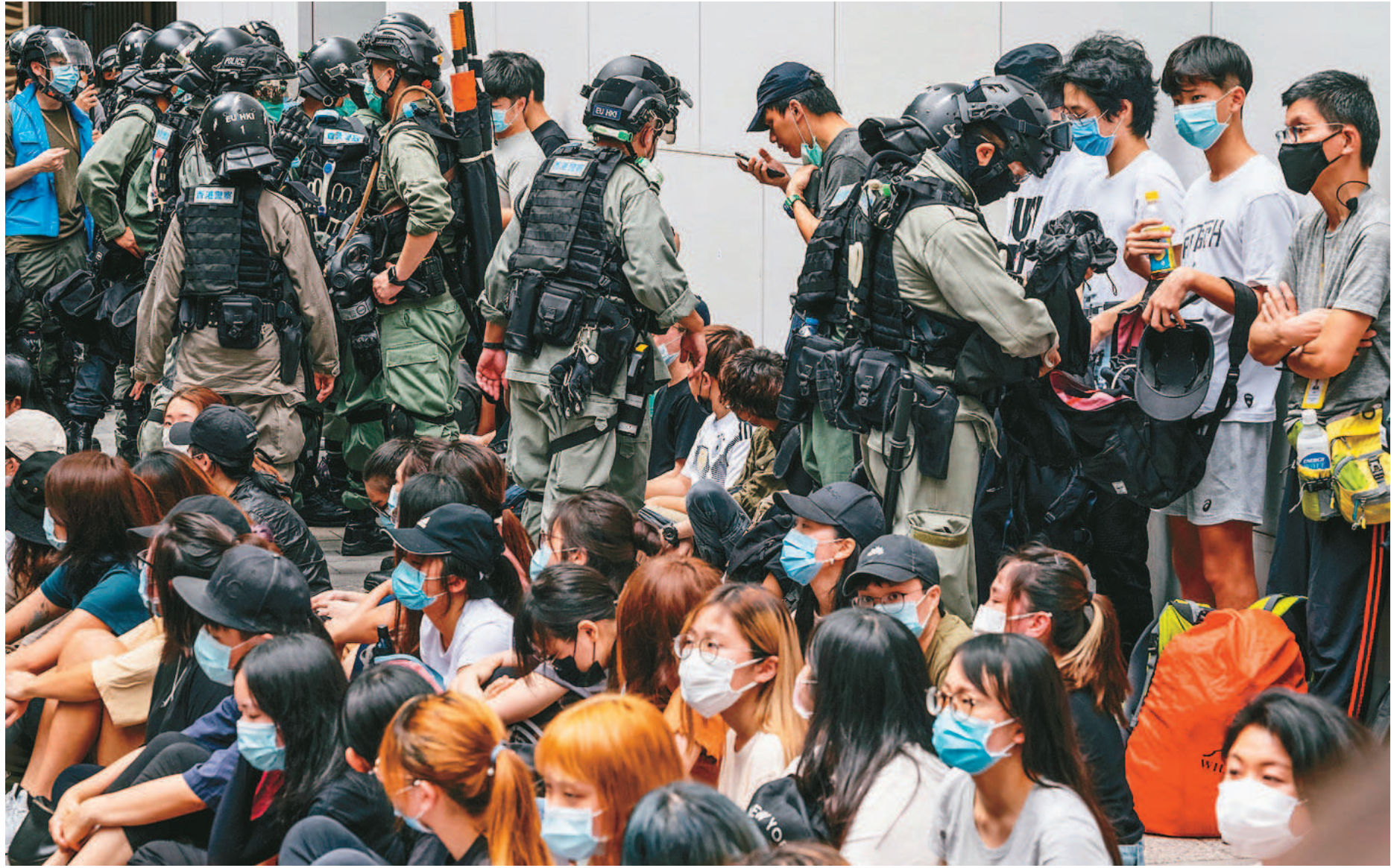
美國國務院認定，香港已無法維持高度自治。圖為香港警方留置抗議港版國安法的香港民眾後，打開他們的背包檢查。

根據1992年的香港政策法，美國將中國大陸治下的香港視為經濟和貿易事務上完全自治