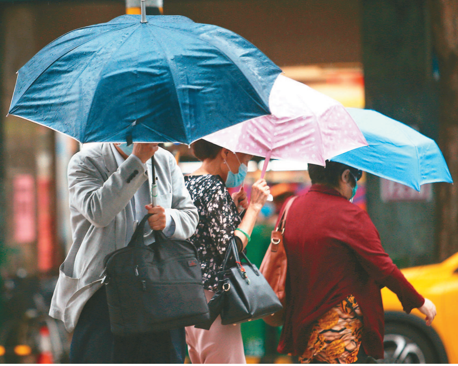
勞動部今公布最新無薪假人數，人數和家數增幅再暴衝，截至5月15日止，實施無薪假人數2萬1067人，家數達到1189家，一周增2067人，增142家。