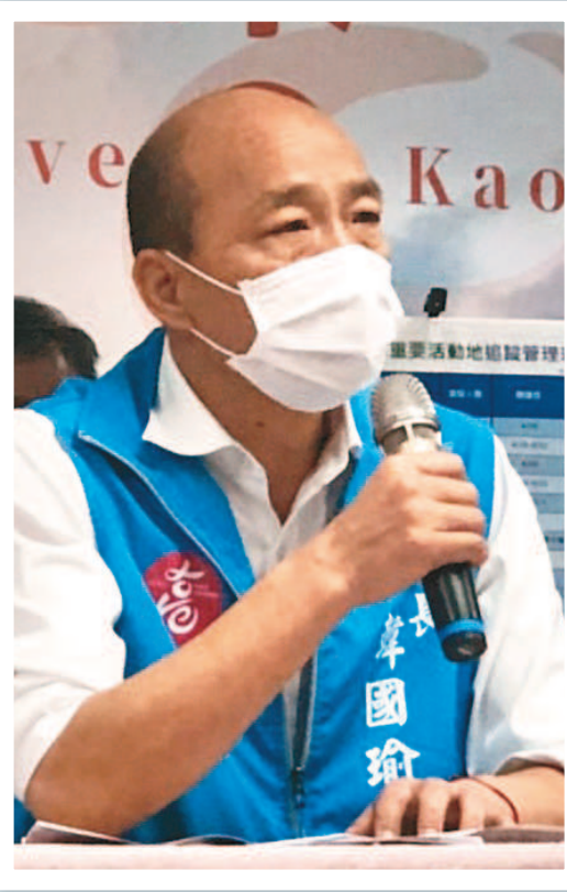
高雄市長韓國瑜今天在四維中心主持新冠肺炎防疫記者會指出，透過足跡熱點追蹤2200多人，有五處、九位市民疑似感染採檢。