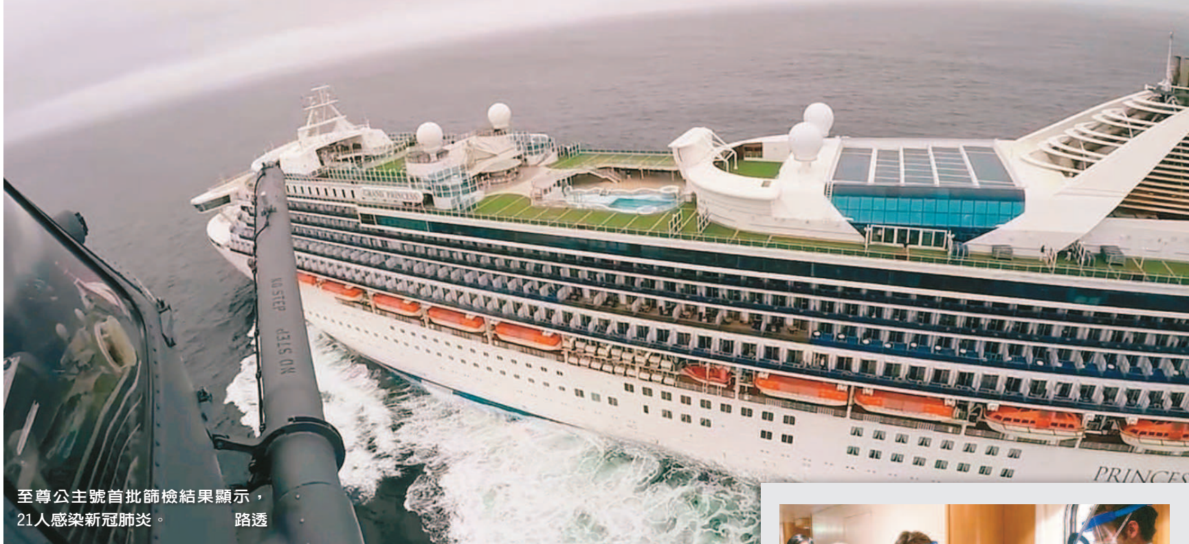
至尊公主號首批篩檢結果顯示，21人感染新冠肺炎。路透

【編譯郭宜含、徐榆涵／綜合報導】停在美國西岸舊金山外海的至尊公主號（Grand Princess）郵輪，已為第一批46人篩檢新冠肺炎病毒，共有21人呈陽性反應，船上旅客和工作人員將陸續受檢。