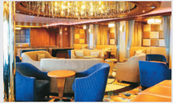
至尊公主號乘客被要求留在艙房內，交誼廳6日空無一人。