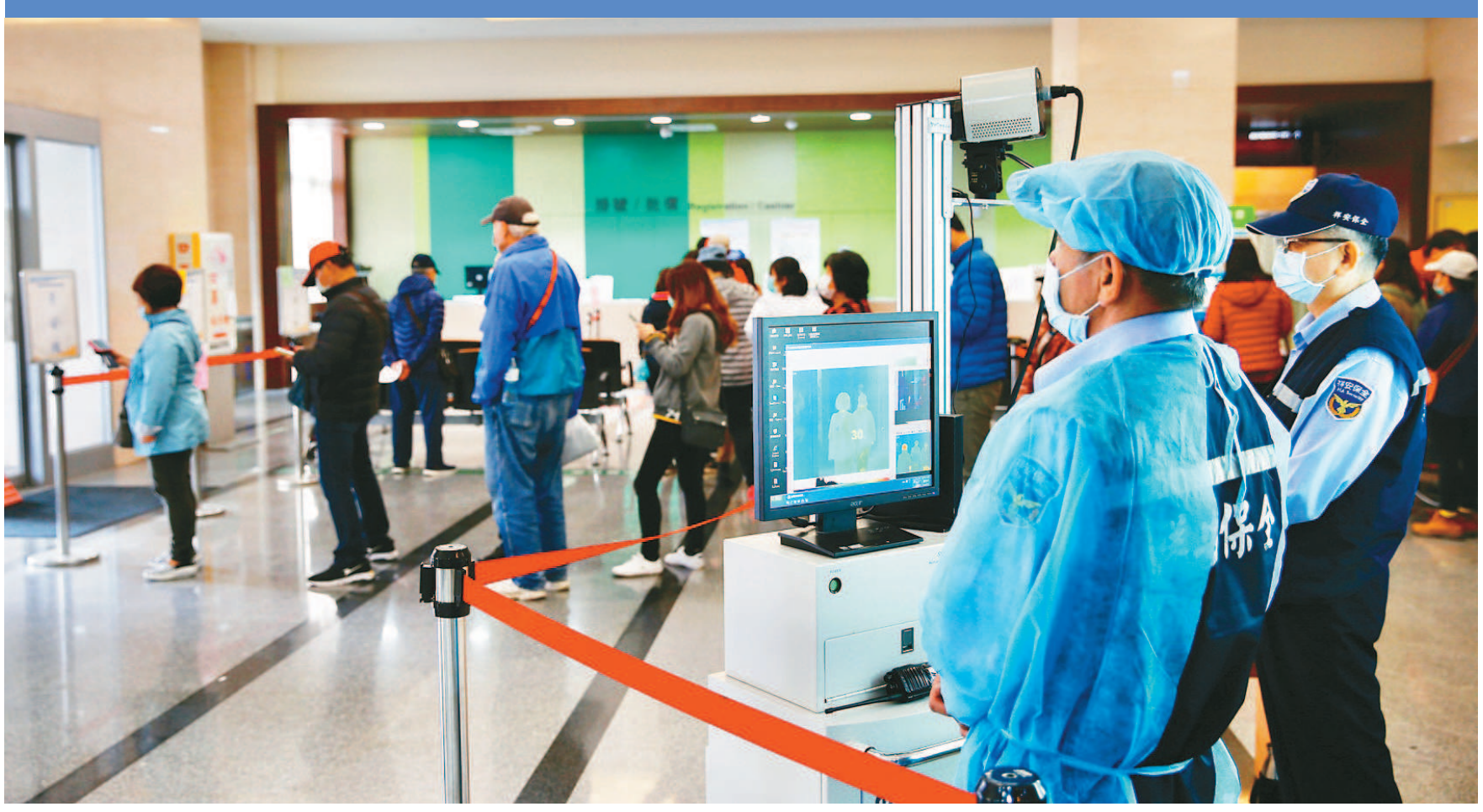
行政院長蘇貞昌上午宣布中央流行疫情指揮中心，從二級提升為一級開設，衛福部長陳時中任指揮官。圖為醫院防疫，步步為營。

【記者賴于榛、簡浩正／台北報導】行政院長蘇貞昌今在行政院會中同意衛福部長陳時中的建議，中央流行疫情指揮中心提升為一級開設，但指揮官仍由陳時中擔任。行政院發言人Kolas Yotaka表示，蘇院長指出，我國窮全國之力守住第一關，目前只有發生零星社區感染，而且是家庭群聚，但防疫視同作戰不可以鬆懈，因此提前做預防社區感染的準備。