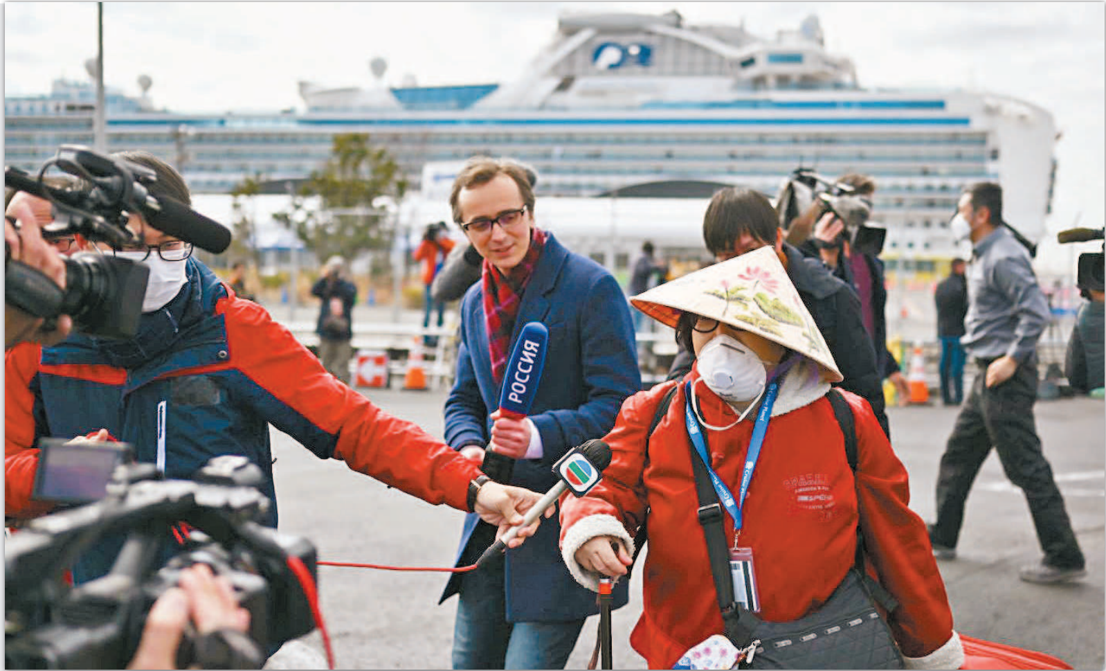
各國乘客陸續離開

鑽石公主號郵輪乘客今天隔離期滿，上午首批約500名新冠肺炎篩檢陰性的乘客陸續下船，媒體試圖訪問一名下船的鑽石公主號郵輪乘客(右)。