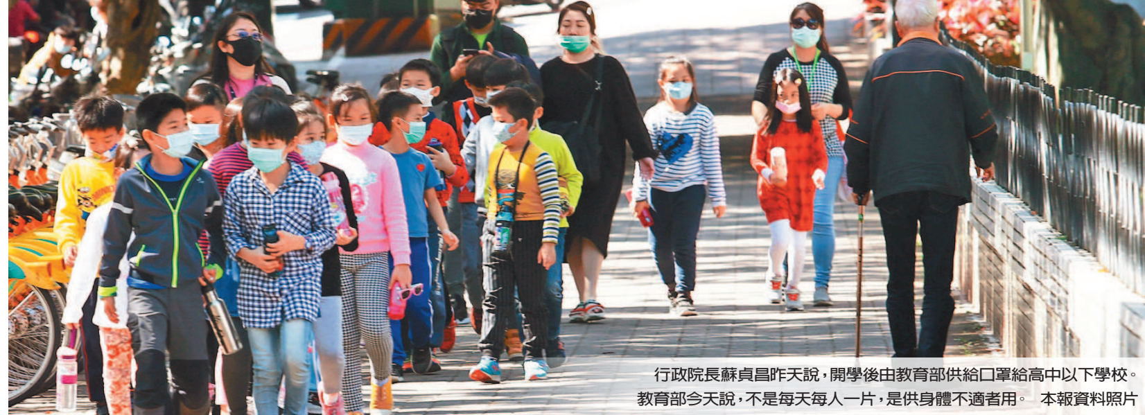
行政院長蘇貞昌昨天說，開學後由教育部供給口罩給高中以下學校。教育部今天說，不是每天每人一片，是供身體不適者用。

【記者潘乃欣、徐如宜／連線報導】高中以下學校預計2月25日開學，行政院長蘇貞昌昨天強調說，開學後由教育部供給口罩給高中以下學校。教育部今天舉行記者會表示，這是「備用口罩」的概念，各級學校（含大學）每50位教職員工生有一盒（50片）做急用，當在校園內發燒、咳嗽、身體不適時，可以配戴，但健康的教職員工生不必戴口罩。