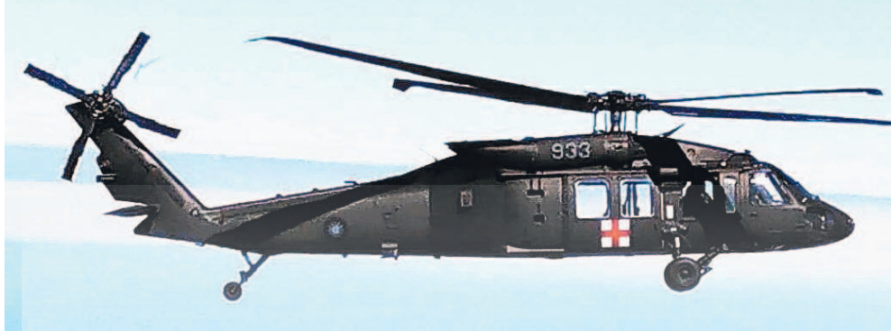
今年1月2日國軍黑鷹直升機墜毀新北烏來山區，包含國防部參謀總長沈一鳴（右圖）等多名將官罹難。