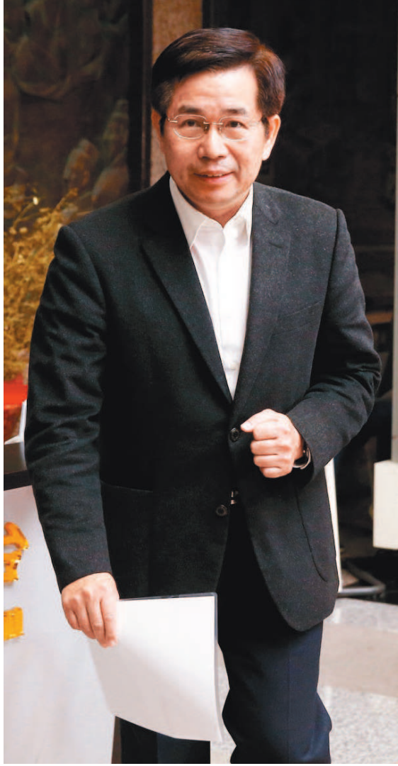
教育部今天宣布，目前已準備645萬片口罩備用，部長潘文忠表示，口罩將優先給有咳嗽、發燒等症狀者使用。