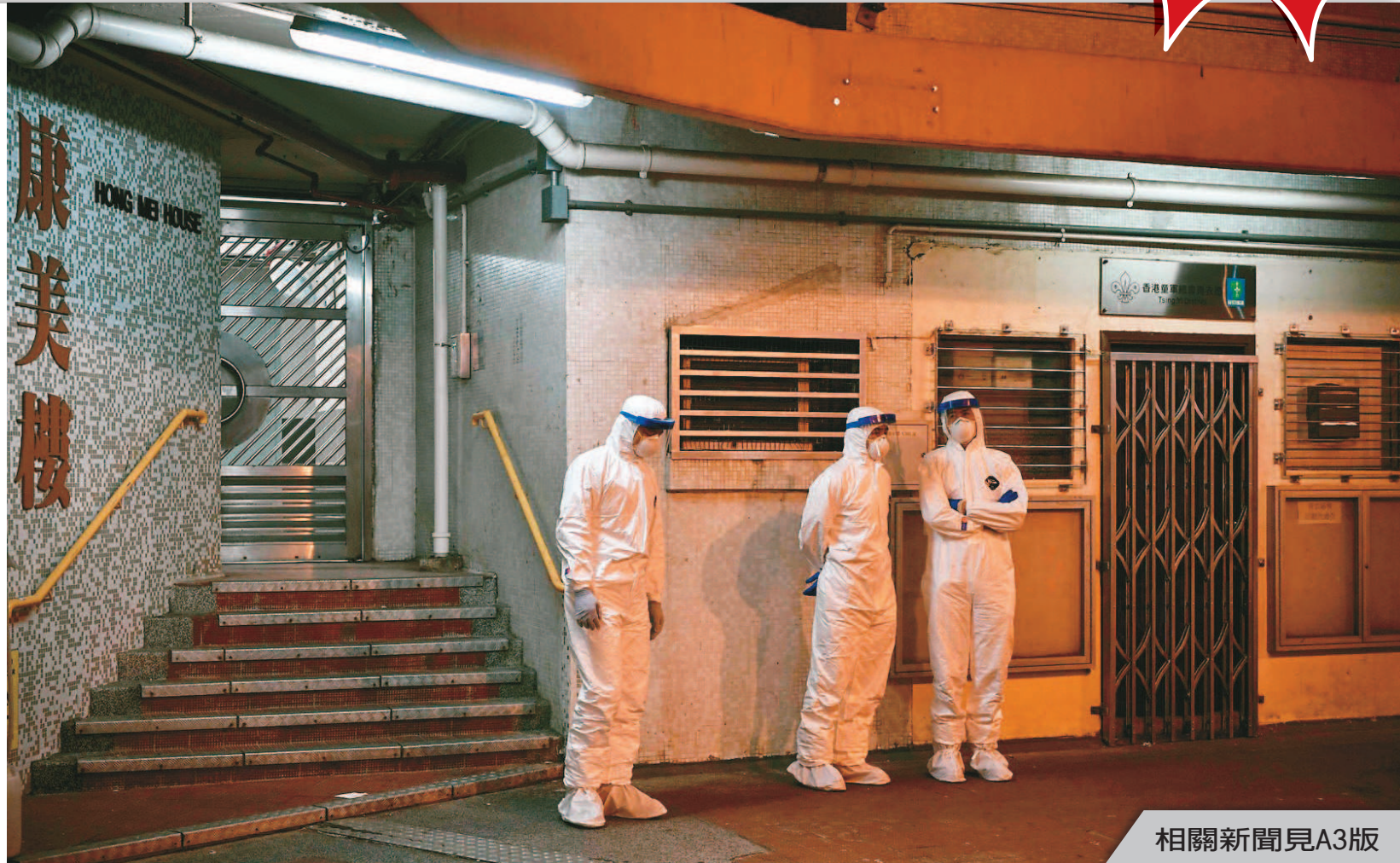
香港國宅康美樓出現樓上和樓下住戶感染新冠肺炎，醫護人員逐家逐戶緊急強制住戶撤離。

康美樓07室兩宗個案，是樓上先發病、樓下後發病，香港環境局副局長謝展寰勘查現場後指出，可能是廁所內開抽氣扇，將帶有病毒的