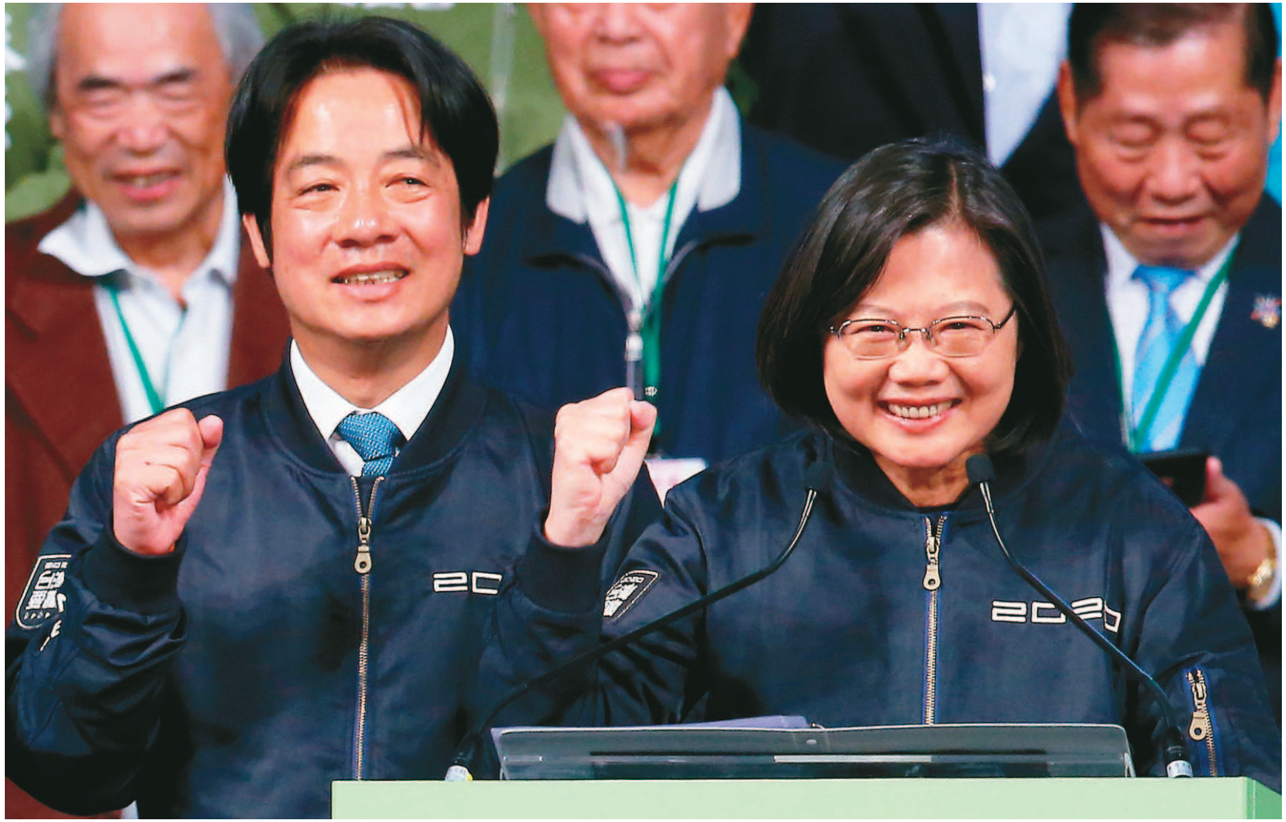
蔡英文總統(右)在2020總統大選以超過800萬得票數連任成功，她與新任副總統候選人賴清德(左)在昨晚到競選總部感謝支持者的力挺。