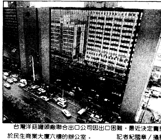
台灣洋菇罐頭聯合出口公司因出口困難，最近決定賣掉位於民生商業大廈六樓的辦公室。

記者林美姿/台北報導 紡拓會今天上午召集22個紡織公會代表召開緊急會議，決定再請立法委員籌組「民間要求公平貿易促進團」之類的組織，就美方要求我作匯率談判一事，赴美進行遊說活動；並決定在11月7日舉行請願遊行，抗議美方無理要求。 今天會中決議，將在11月7日到中央銀行、財政部和美國在台協會請願遊行，並將請立法委員力促政府抗拒美國無理要求，明天早上十點紡拓會將推派代表到經濟部與中央銀行和首長溝通。