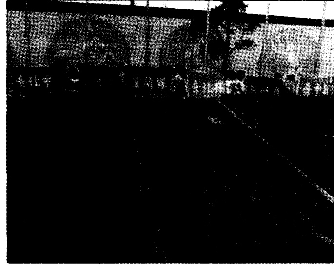
77年區運25個縣市的代表隊，今天上午在苗栗縣立體育場舉行升旗典禮。

記者涂振華 / 台北報導 由於美國將與中韓兩國談判匯率，外匯市場銀行間美元交易上午各匯銀全力拋售美元，美元匯率一度偏離中價3角5分，跌至28.40元的價位。 週一各匯銀曾為補足美元淨部位，搶進美元，而使得新台幣在升值兩角後，反轉貶值1分，「想不到放了一天假，世界全都變了」；銀行對顧客美元買賣上午也是一面倒現象，匯銀營業部門說，明天熱錢湧進，大家又得忙到晚上11時，才能收工了。 匯銀說，今天各匯銀手中籌碼在10月新台幣升值時，已拋售得差不多了；因此上午交投雖然熱絡，但截至12時僅成交2.5億美元，而這期中中央收購了過半的美元成交。 央行官員分析，新台幣升值不但會影響出口競爭力，且對央行緊縮貨幣政策，也會產生干擾；官員說：「既然是交換意見，我們也有予以拒絕的可能。」 對於中美匯率談判的時機，央行官員表示，匯率這麼敏感的事，怎麼可能擺在桌面上討價還價？他說，12月初中美工商聯合會議將在台北舉行，屆時雙方會有機會「私下交換意見的」。