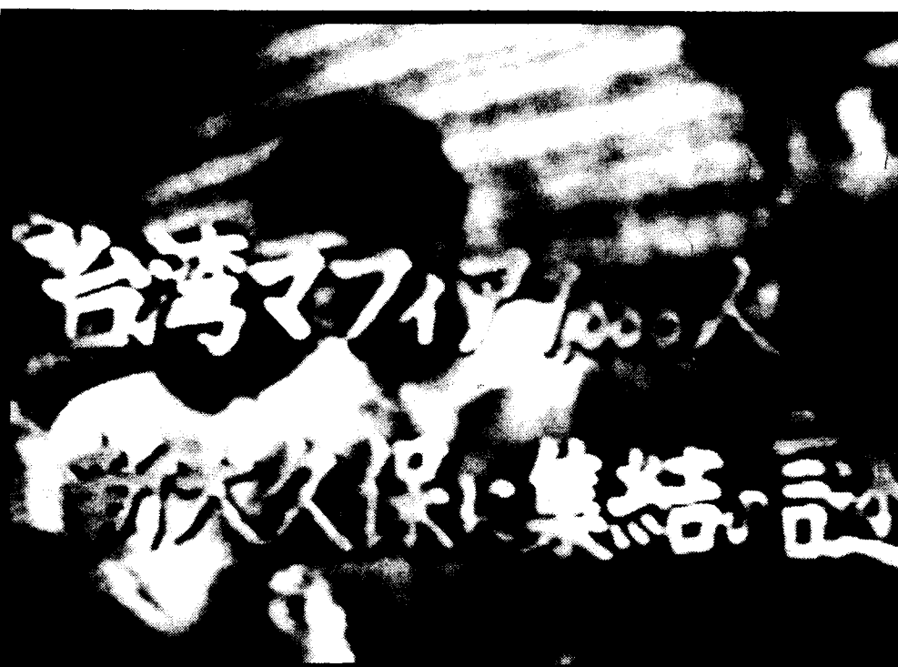
台灣黑道份子赴日者日多，日本富士電視台專題報導，有一千人在日本新大久保發展勢力。

富士電視台並在節目中，指明「竹聯幫」份子齊瑞生命案，「四海幫」份子劉偉民被槍殺案，及新大久保台灣人開設的賭場被槍357萬元的事件。