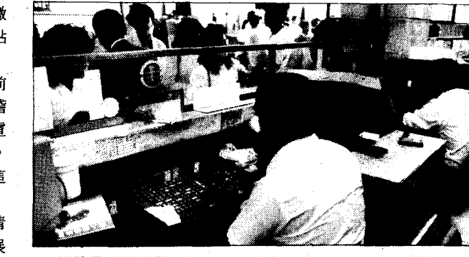
鐵路局實施的電腦售票，發生吃票弊案，調查局正追查。

記者徐麗冰、邱淑宜 / 台北報導 鐵路局正進行的推廣電腦售票業務，不料爆發吃票弊案，售票員利用作業漏洞，集體吃票。法務部調查局台北市調查處今天上午展開約談行動，台北站八名售票員、二名會計人員到案後，正接受探員偵訊中，全案將在下午清查初步結果。 據調查，目前已明朗的作弊手段之一，是售票員利用已實施電腦售票與尚未實施的各站之間換票的機會吃票。據鐵路局說明，逐步推廣中的電腦售票業務，目前只有台北站、板橋站、萬華、板橋等四站實施。 不過，售票員卻利用旅客在其他車站購買來回票，而在台北向站方換票準備回時，依規定應將來回票的「回票」票根繳回，而換領電腦票使用，售票員理應將收回的一般「回票」票根繳銷，售票員們不繳繳銷，而向站方以旅客未使用、已退票為理由，領取票款。售票員就是利用目前並非全部使用電腦，而鐵路局稽核人力又不足以清查電腦與非電腦之間的售票業務，而進行吃票。 據悉，鐵路局在長期發現有這種吃票的情況時，認為問題嚴重，於是向調查局報案，雙方配合清查了一個多月，今天上午終於展開約談。 據悉，今天上午約談的對象，全是台北站的售票人員，共有八名，另兩名是會計室人員，目前正在進行偵訊中。探員認為，這些人員中，究竟誰有涉嫌，以及是否還有其他的涉嫌人，尚不夠明確，而且這種電腦售票業務的詳細情況，也必須進一步查證，因此全案將須清查之後，才能對犯罪手法以及損害情況有個概括了解。