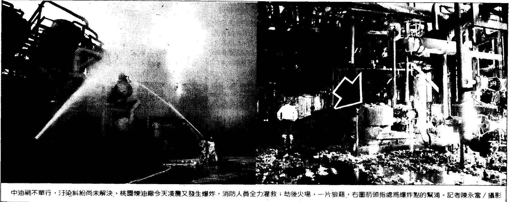
中油禍不單行，汙染糾紛尚未解決，桃園煉油廠今天凌晨又發生爆炸，消防人員全力灌救，劫後火場，一片狼藉，右圖箭頭所指處為爆炸點的幫浦。