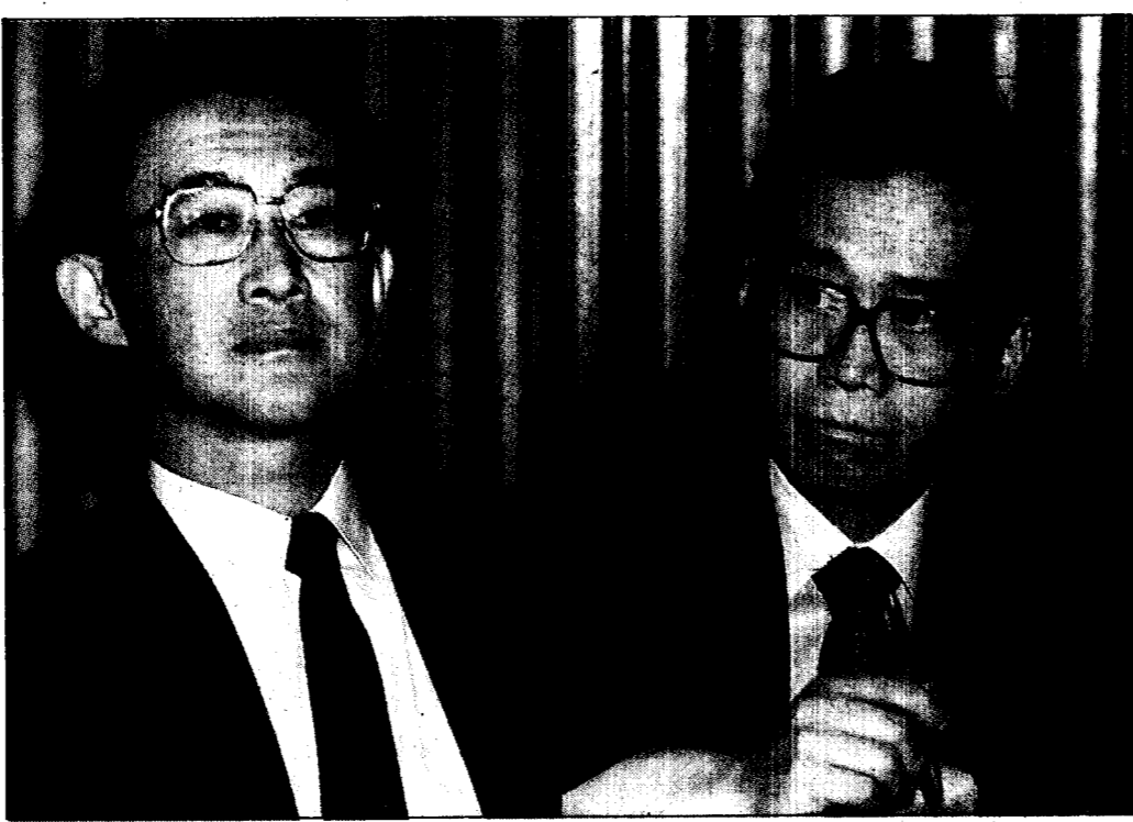
立法院會議今天上午為林園污染事件，引發激烈討論，立委抨擊矛頭指向經濟部長陳履安和環保署長簡又新，「環保與經濟發展孰重？」真敵兩位首長為難。

記者許正雄 / 大社、仁武綜合報導 高雄縣林園石化工業區各工廠連續三天全面停工後，今天已開始嚴重影響到仁大工業區的各中下游石化廠，以生產塑膠粉(PVC)佔國內百分之七十的台塑仁武廠，今天上午全部停俾，以生產乙二醇化纖主要原料的中纖高雄廠，今天凌晨起一條生產線也被迫停俾，以此為原料的中、下游工業將受嚴重打擊。 高雄縣仁大工業區包括大社石化專業區及仁武工業區，其中大社石化工業區僅次於林園石化工業區，為國內第二大石化區，目前有中纖高雄廠等十一家石化廠。而仁武工業區則以台塑及南亞等中、下游石化工廠為主。 台塑仁武廠的PVC及VCM兩廠，是國內生產塑膠粉等原料的主要工廠，所需要的乙炔原料，有三分之二來自中油林園輕油裂解廠。在中油林園廠停工後，發生原料不足現象，僅依賴中油高雄煉油總廠的乙炔繼續生產，但生產三天後已無法再「支持」，今天上午兩廠先後宣佈全部停俾。 這兩廠的塑膠粉產量每年有四十二萬噸，佔國內產量的百分之七十以上。停工後，除非緊急進口，否則相關中下游石化各廠勢必全部停俾。 台塑關係企業的南亞仁武廠，以生產膠皮膠布為主，在台塑仁武廠塑膠粉原料供應中斷後，今天開始大量減產，預計今天晚上可能也被迫停俾。 國內兩家生產「乙二醇」的中纖高雄廠及東聯，原都已無法充份供應中、下游紡織化纖業，東聯(位於林園石化區)被迫停工後，僅靠中纖高雄廠的兩條生產線，一天可生產四百噸，但在乙炔供應不足下，今天凌晨也將其中一條生產線停俾。 中纖高雄廠的乙二醇，以供應遠東化纖等八家紡織業為主。大社石化區十一個石化廠，有八家依賴中油林園廠的乙炔，在中油林園廠停工後，都在減產中，短期內不恢復，影響更大，中、下游一萬家以上的紡織及塑膠產品工廠將會一一被迫減產或關門。