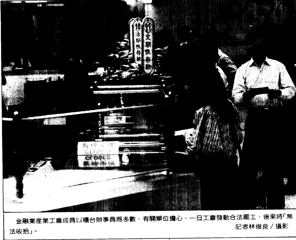
金融業產業工會成員以櫃台辦事員為多數，有關單位擔心，一旦工會發動合法罷工，後果將「無法收拾」。

記者陳秉秋／台北報導 國民大會憲政研討會第一研究委員會，今天上午召開召集人會議，提出針對國民大會組織及職權問題的研討結果草案。據了解，由於執政黨國大黨部日前對主席團於閉會期間行使職權的建議仍不表贊成，預料在今天的召集人會議上將引起爭議。 雖然在黨內積極協調下，第一研究委員會日前決議將研討結果限於「憲法規定範圍內」，而引起甚多爭議的「議長制」問題，也在黨內積極勸阻下，決定召開全體委員會討論時再討論。 但為使國民大會成為實質常設國會，國代們仍在研討論論草案中，建議由國民大會制定「主席團職權行使辦法」，規定主席團於閉會期間仍可繼續行使職權，以彌補立法院通過之「國民大會組織法」的不足；草案中並強調「主席團職權行使辦法」應視為國民大會「內規」，可由國民大會獨立制定，以迴避立法院的審查。 針對立法院獨攬預算權一事，憲研會也要求在臨時條款中增列條文，賦予國民大會「預算複決權」，當立法院審查預算結果違反「國家利益」，如削減國防預算以致妨礙國家安全時，國民大會可提案進行複決，以避免立法院一院獨大。