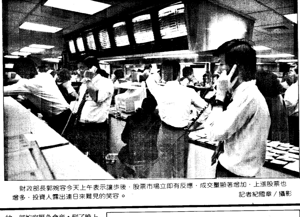
記者嚴智徑、尹復生/台北報導