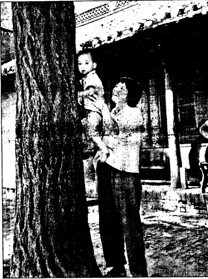
▶郝柏村小時候愛爬的樹。