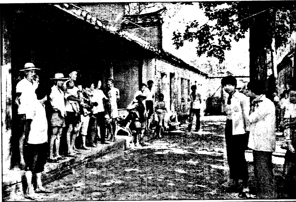
▲郝家村的村民圍在郝總長老家前，談論他們心目中的英雄郝柏村。

知郝總長在軍中的「爬」升，一點也不覺得意外。 直到今天，不少村內的年輕媽媽，仍經常抱孩子攀爬上那棵樹，希望孩子也能像郝柏村一樣，當大官。 談到郝總長的家人，村民們不勝唏噓。郝總長的父母已雙亡，留在大陸的弟弟在文革期間，因郝總長的緣故受到迫害，而一度避過他鄉，至二年前才「平反」回到故里；同時，中共不知基於什麼理由，竟還撥了二千元人民幣，為郝柏村家重建祖先衣冠塚，且大大宣傳此事。從此，村民們才敢公然談郝柏村，郝家村也因此在大陸提高不少知名度。 「鄉情報導」人員前往郝家村訪問時，他弟弟不在家鄉。不過，由村民不斷詢問郝柏村的近況，顯示家鄉故人相當關心他。 郝家村有二千多人口，村民90%都姓郝。不少村民希望「鄉情報導」人員代他們向郝總長致意，以及以他為榮的驕傲。