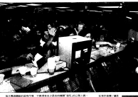
股市發燒，公務人員趨之若鶩，上班時間去「掛號」，查到要處分。

【本報記者/鄭文輝報導】股市發燒，公務人員趨之若鶩，上班時間去「掛號」，查到要處分。據悉，公務人員在上班時間去「掛號」，是為了查詢股市行情，但由於股市波動劇烈，導致公務人員在上班時間去「掛號」，被查到要處分。 據悉，公務人員在上班時間去「掛號」，是為了查詢股市行情，但由於股市波動劇烈，導致公務人員在上班時間去「掛號」，被查到要處分。據悉，公務人員在上班時間去「掛號」，是為了查詢股市行情，但由於股市波動劇烈，導致公務人員在上班時間去「掛號」，被查到要處分。