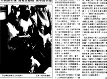
野鷄車放炮，業者與司機。圖為現場情況。

【本報記者林文郎報導】野鷄車放炮，業者與司機。據悉，野鷄車在罷駛期間放炮，擾亂了公共秩序。業者與司機之間發生了爭執，雙方均表示將採取法律行動維護自身權益。