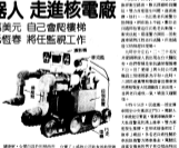
▲首位機器人昨日走進核電廠，將任監視工作。該機器人價值五十萬美元，具有自主爬樓梯的能力。

【本報訊】首位機器人昨日走進核電廠，將任監視工作。該機器人價值五十萬美元，具有自主爬樓梯的能力。 這台機器人是美國通用電氣公司研發的，名為「Robocon」。它具備高度靈敏的傳感器和先進的移動系統，能夠在複雜環境中自主導航。 目前，這台機器人已在核電廠內進行測試，預計將在未來幾週內正式投入運行，負責核反應堆的監測和維護工作。