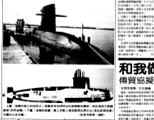
▲海龍潛艦昨日展示了其發射飛彈的能力，並深入展示了其戰鬥系統。

【本報訊】海龍潛艦昨日展示了其發射飛彈的能力，並深入展示了其戰鬥系統。 海龍潛艦是台灣海軍的主力潛艇，具有優秀的隱蔽性和作戰能力。此次展示，突顯了其在遠程奔襲和精準打擊方面的優勢。 此外，潛艦的戰鬥系統也得到了進一步的完善，使其在複雜的戰場環境中更具競爭力。