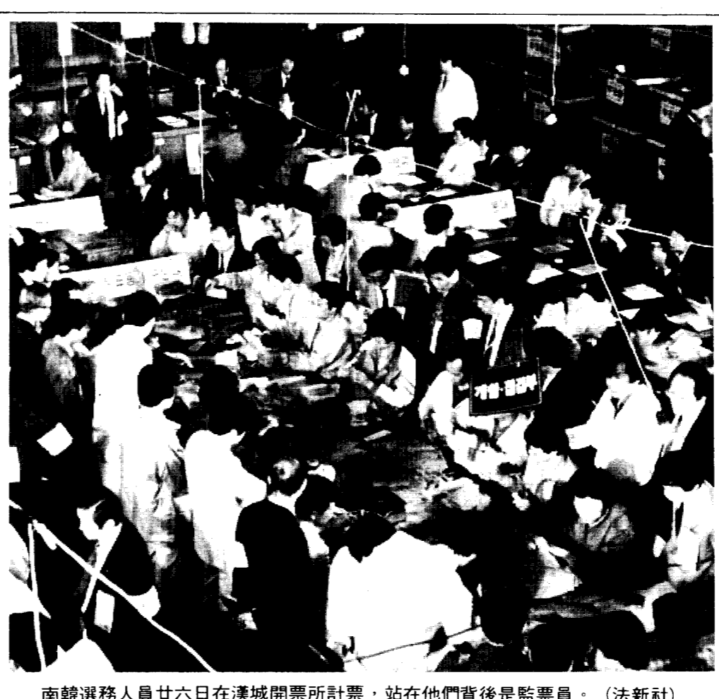
南韓選務人員廿六日在漢城開票所計票，站在他們背後是監票員。

民正黨得票率雖居第一，但已喪失多數黨地位 兩大反對黨囊括多數席，國會和政府將處於對立