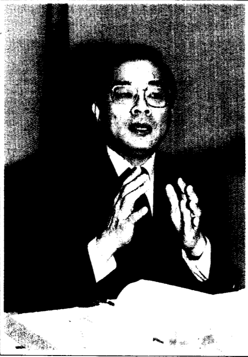
法務部長施啟揚，今天上午就明天的減刑措施舉行記者會。

揮別鐵窗 不說再見 記者徐履冰 / 台北報導 法務部長施啟揚今天上午正式宣佈，七十七年共有二萬二千零九十九人可獲減刑，明天(實施日)有六千零五十四人同時獲減刑走出監獄。 施部長引用周聯華牧師語：「饒恕是上帝賜給人的禮物」，希望社會接納出獄人。施部長也公開表示，出獄人應痛改前非，如有再犯，將通令檢察官從嚴追訴，並請法院從重量刑。 法務部正式發佈的統計資料顯示，廿二日當天走出監獄的出獄人，包括： (一) 犯懲治叛亂條例二至七條者，計有戴華光等十九人。另外，軍、司法執行中者還有十四人，二人因參加共產黨不能減刑，十二人因減刑後刑期仍未滿，不能當天釋放。 (二) 犯貪污治罪條例者一百八十八人，其中被判無期徒刑，減刑後能當天出獄的有白慶國等十二人。 (三) 犯肅清煙毒條例者二百二十五人。 (四) 犯妨害國幣條例者三人。 (五) 犯懲治盜匪條例者卅三人。 (六) 犯陸海空軍刑法八十四條結夥搶劫者七十二人。 (七) 犯刑法普通殺人罪者卅三人。 以上均為適用甲類減刑，減刑幅度為三分之一，適用乙類減刑者為五千五百五十二人，其減刑幅度，按減刑條例規定不等。 施啟揚部長說，希望出獄人在民事方面未賠償