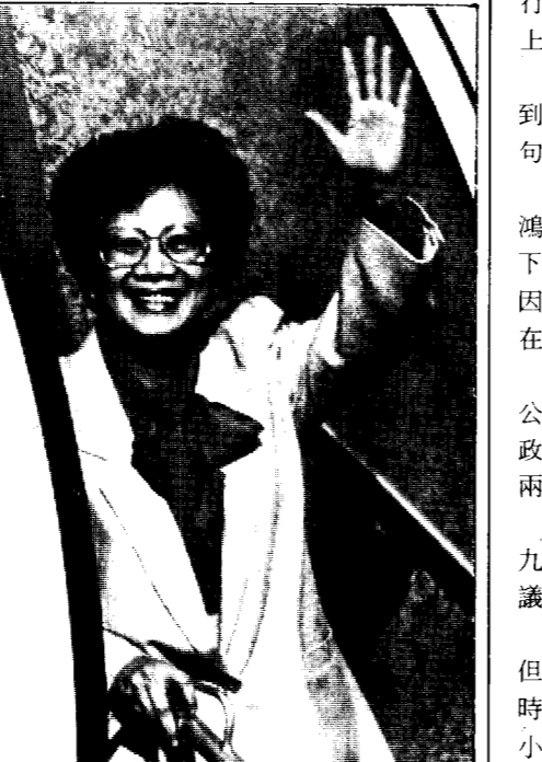
菲律賓總統艾奎諾夫人十四日啟程前往中國大陸訪問前，在總統專機梯上，向送行人員揮手道別。

【本報綜合外電報導】菲律賓總統艾奎諾夫人今天上午九時十分抵達福建省廈門機場，受到中共紡織工業部「部長」吳文英和福建「省長」王兆國等的歡迎。 艾奎諾夫人十四日清晨由馬尼拉啟程前，指示 內閣，防範新政變的威脅，保障國家安全無虞。 艾奎諾夫人一行包括十六位高級官員和她的兩個女兒。他們在大陸訪問三天後，定十六日飛往香港過夜，次日返國。 由於政變首領納索逃脫，艾奎諾夫人出國時可能發生政變的謠言甚囂塵上。艾奎諾夫人在臨行演說中表示，她此行是否明願受質疑，事實上取決於訪問才是愚不可及，此行本身就是明證。 艾奎諾夫人在大陸期間，除正式訪問外，並將到福建鴻漸村的曾祖父故居尋根，她還特別學了幾句中國話，準備和鄉親話家常。 艾奎諾夫人的曾祖父姓許，他在127年前，由鴻漸村渡海前往西班牙殖民統治下的菲律賓開天下，有感於中國移民從事低賤工作永遠無法出頭，因而改奉天主教，并把姓名改為荷西·許寶哥，在馬尼拉以北的呂宋島中部平原定居。 許寶哥終於以產植蔗糖致富，土地多達六千多公頃。許寶哥的曾孫女柯拉蓉，嫁給菲律賓著名政治人物艾奎諾，在艾奎諾遭暗殺後，柯拉蓉在兩年前成為菲律賓元首。 中國是艾奎諾夫人源遠流長的根之所在，去年九月她曾委請男眾議員議長蘇穆隆，和弟弟眾議員何塞·許寶哥等人，到鴻漸村尋親。 艾奎諾夫人在大陸的唯一血親是叔父許源興，但是當菲國尋親貴賓去年九月廿八日晚到鴻漸村時，當地共幹竟許源興與許源興之子，軟禁四小時；而把菲國訪客帶到冒名頂替的潘姓人家。 許源興幼年喪父，母親再醮潘家，前些年潘家後人突然改姓許，而且佔住許家祖厝。當地共幹竟設計魚目混珠，要這家人冒充艾奎諾夫人的血親。