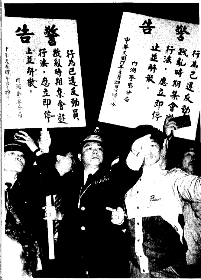
警方在現場採取了強硬措施，但群眾仍不罷休。