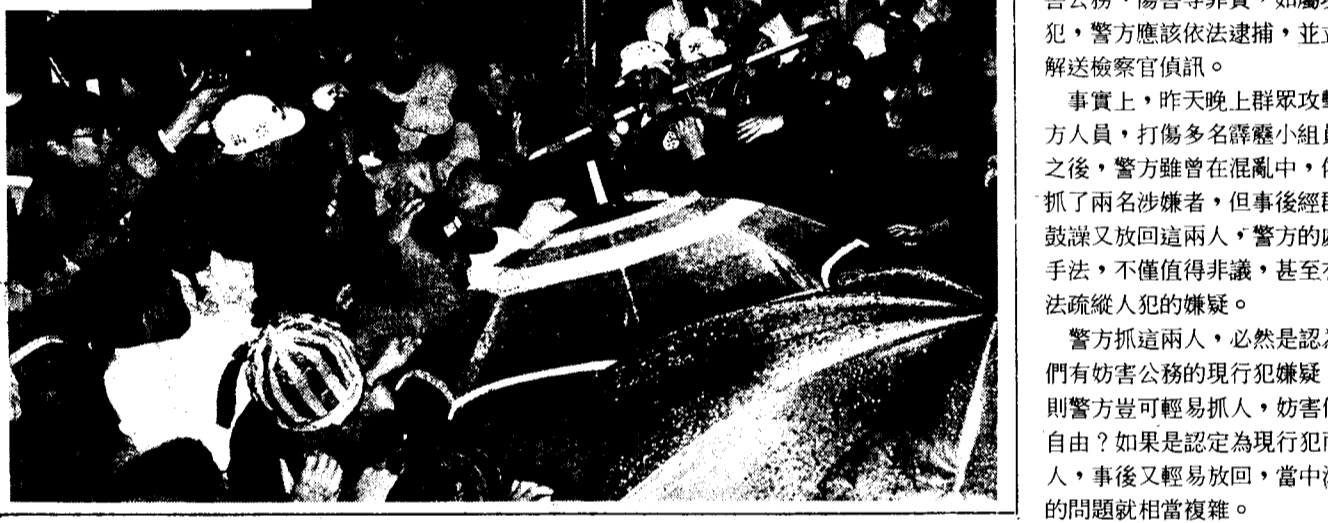
群眾在現場抗議，要求警方正視問題。

禁各級黨部工作同志暗中暗示或影響黨員投票支持對象。 這項辦法分配名額的基本原則為： 1.各種黨部代表名額，以第十二次全國代表大會各種黨部之代表數為基準，按照第十二次大會後，各種黨部實際增加之黨員人數及組織特性遞增其代表名額。依此原則，台灣省黨部所分配之名額最高為二八七名，其次為孫中興七八名、國民大會黨部六六名、台北市黨部五六名、國軍退役官兵黨員黨部五三名、高雄黨員黨部三三名、生產事業黨部三三名、北區知識青年黨部三三名、立法委員黨部三四名、監察委員黨部一九名、航運事業黨部一八名、南區知識青年黨部一七名、中區知識青年黨部一六名、新聞黨部一五名、鐵路黨部一四名、公路黨部一四名、電信黨部一三名、郵政黨部一三名、金門黨務辦公處八名、馬祖黨務辦公處五名。 2.代表名額以復興基地各種黨部為主，計有八二九名，佔出席人員總數百分之六八.五六，海外代表一八〇名，佔出席人員總數百分之二四.八八，及大陸代表五〇名，佔出席人員總數百分之四.一三為輔。此外，中央委員一五〇名(較上次大會增加二九名)為當然出席人員，佔百分之二二.四〇。 3.大會代表保障名額設置情形則是：本次代表大會設置代表保障名額之類別共計十一類，除原有之婦女、農民、漁民、工人、山