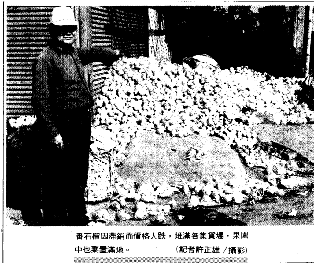
番石榴因滯銷而價格大跌，堆滿各集貨場，果園中也棄置滿地。