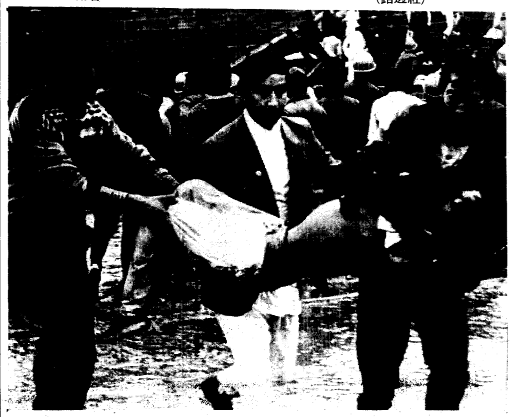
尼泊爾首都加德滿都的國家體育場十二日在比賽足球時，觀眾因為爭相躲避突然而來的冰雹而互相踐踏，估計有一百多人被踏死，幾百人受傷，圖為援救人員正在搶救傷者。