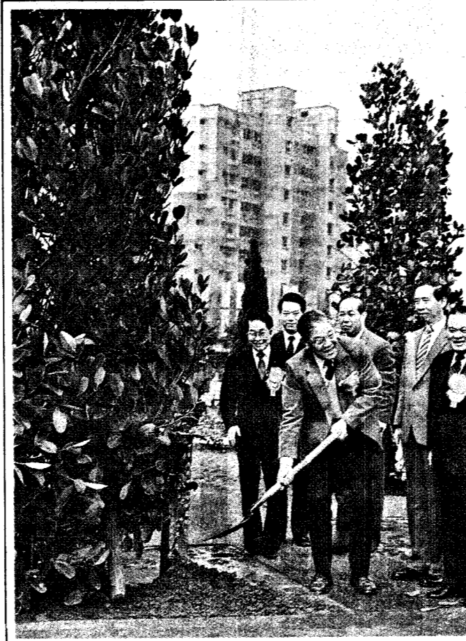
今天是植樹節，李總統登輝先生在台北市基河公園手植福木一株誌念。

記者何來美 / 苗栗報導 李總統登輝先生今天上午建議苗栗縣農會，認真研究鼓勵老人多喝鮮乳及部隊早餐改喝鮮乳的可行性，以解決冬季鮮乳滯銷的問題。 今天上午九時卅分，李總統由縣長謝金汀陪同，巡視了住在造橋鄉，生產將軍牌鮮乳的鮮乳工廠。總統非常關心冬季鮮乳滯銷的問題。他表示，鮮乳營養豐富，應該鼓勵老人多喝鮮乳。 隨後，李總統轉往許健一農友