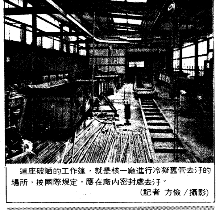
這座破爛的工作篷，就是核一廠進行冷凝管去汙的場所，按國際規定，應在廠內密封處去汙。

台電說 輻射外洩不可能 記者張景明 / 台北報導 台電公司發言人朱善增今天表示，蘇聯各核能廠都有層層的防護關卡，二十四小時偵測核能機組的運轉，因此絕對不可能發生輻射外洩而廠方毫無所悉的情況。 朱善增昨天恰巧隨同慶祝台電創業一百周年活動團體前往核一廠，並在該廠獲知立委質詢核一廠輻射外洩一事。 朱善增說，每一座核能電廠都有一百八十個自動偵測站，分佈於距離廠房二公里、五公里和八公里的區域內，如果核能機組有任何故障，導致輻射外洩，這些偵測站會立即發出警訊，通知廠方關機，絕無意外的機會。 核一廠一號機現值歲修，二號發電量為五十九萬瓩。距離最高發電廠六十七萬瓩還有一段空間。 朱善增認為，核一廠員工詹如意向立委提出陳情，主因在於詹曾向公司申請公傷假未獲核准的緣故。