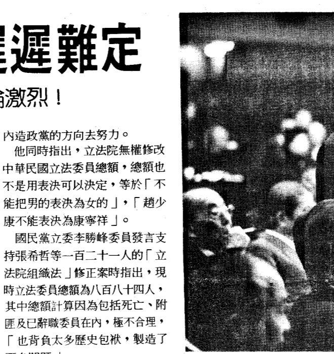
俞國華與朱高正會面談話的場景。

這場長達一小時的「私人約會」，據朱高正事後透露，主要談論憲政體制改革問題，朱高正向俞院長表示，改革當今憲政體制，應當從修正動員戡亂時期臨時條款著手，而且，透過這修正程序，既保留「動員戡亂時期」，也可解決目前面臨的國會全面改選難題。朱高正事後表示，他很訝異俞院長對改革憲政的看法竟和他相去不遠。朱高正在這約會中並曾與俞院長談及「蔡、許台獨案」及「許信良返台案」；朱高正向俞院長表示，希望讓許信良返台，俞則認爲目前不是適當時機；有關「蔡、許台獨案」，朱高正曾向俞院長分析台獨的現況，並且認爲「蔡、許案」判得過重，反而激盪「台獨問題」，俞則表示司法審判獨立，行政院不便置喙之外，同時也指出，許多政治案件刑罰雖重，服刑過半也就假釋出來了。安排這場會面的行政院及立法院有關人員表示，不同立場的政治人物私下溝通在民主開放社會裡，應當是極爲平常的事，但在台灣的政治文化裡，卻容易滋生困擾，因而希望隱密行事；事實上，俞院長與其他立委私下的溝通，也是持續進行，祇是最近較積極罷了。