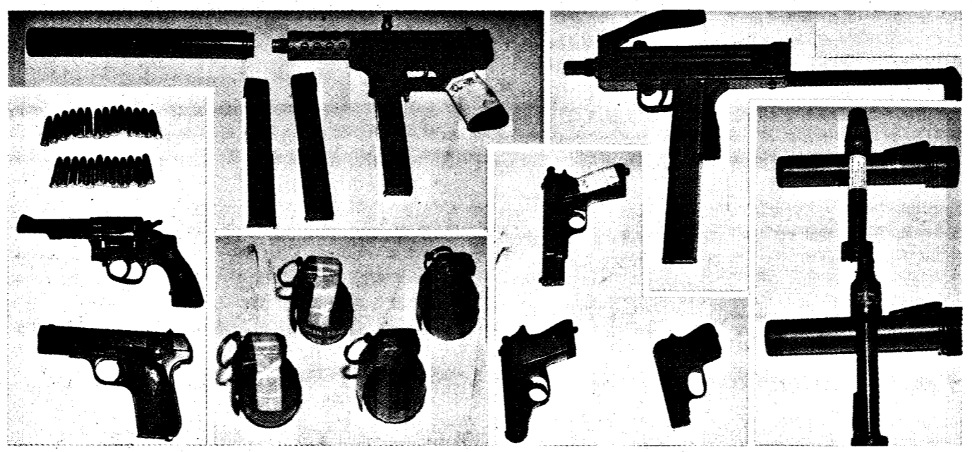
警方在台灣地區查獲的槍械彈藥、型式愈來愈新，殺傷力也愈大。

記者韓國海/台北報導 刑事警察局統計，七十六年台灣地區共取締非法槍械一千三百一十支，其中制式手槍一百廿支，制式長槍十五支，長槍的類型包括衝鋒槍，M十六自動步槍，半自動步槍，這些武器足可裝備一個輕裝的營級部隊，顯示台灣地區的私槍問題，日益嚴重。 據警方指出：通稱「制式」的槍械，是指各國軍火工廠專門製造的槍支，不僅採用的鋼材優良，故障率極低，而且經由專門測試，槍支的準確度精良自不用說，殺傷力之強更是驚人。 據刑事局鑑定單位比較資料顯示，制式槍械的威力，約為一般土造槍支的三至五倍。這是不法份子亟欲擁有制式槍械的最大原因。 刑事局指出，單以被查獲的槍械彈藥數量，即可裝備一個營級的部隊編組。 據刑事局人員透露，全省各地未查獲的槍械數量，應該還三倍於此，問題實在嚴重。 依據刑事局清查取締槍械的種類，除了制式槍械外，以金屬玩具改造手槍數量最多，達四百九十七支，其次為鋼筆手槍二百五十六支，再次為魚槍一百九十六支，土製手槍一百卅五支。 由於查獲制式槍械數量的增加，充分顯示了非法持用者火力的增加，自然嚴重影響社會的安寧。 刑事局表示，全年查獲各類制式手槍計一百廿支，各類制式長槍十五支，長槍種類中，包括衝鋒槍兩支，M十六自動步槍一支，半自動步槍三支。 刑事局並表示，由於查獲的槍械數量龐大，顯示台灣不法份子彈藥的等次，已朝強力槍械方面發展，意圖達到更大的殺傷破壞力，今後社會治安維護，對警方來說，將不僅是「亮起紅燈」的單純意義，將不僅是「亮起紅燈」的單純意義。