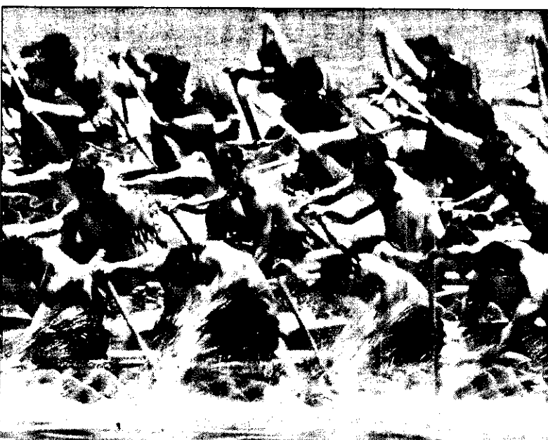
賽開舟龍天陽艷天風颭 運的賽舟龍國北台加參，照高陽艷是仍北台昨，襲來風颭然雖

【記者羅清源／台北報導】民進黨主席謝長廷昨天晚間到前總統李登輝的住所翠山莊，秘密會晤，雙方就李系政團的定案、選後政局走向交換意見，謝長廷對李登輝保證，李政團與民進黨之間是合作關係，不是競爭關係；政團成立後不會搶民進黨的票，否則就失去合作的意義。 謝長廷在晤談中，保證政團不會搶選票，謝稱樂見擴大民進黨席次。謝長廷在晤談中，保證政團不會搶選票，謝稱樂見擴大民進黨席次。謝長廷在晤談中，保證政團不會搶選票，謝稱樂見擴大民進黨席次。