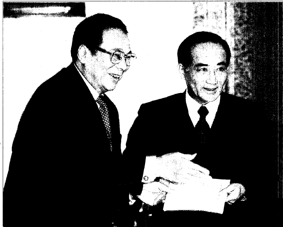
總統昨天接見美國前參議員索拉茲時強調，「對話、交流與擱置爭議」是政府處理兩岸問題重要的思考與基調。

【記者鍾年晃、凌佩君／台北報導】陳總統昨天接見美國前參議員索拉茲時強調，「對話、交流與擱置爭議」是政府處理兩岸問題重要的思考與基調，我方已作好準備與中共復談，也不設限議題，無論大三通、小三通，甚至任何政治性議題皆不排斥，「我們的位子及待客的茶皆已準備好，就等待對方坐下來展開對話。」 對於軍售問題，陳總統表示，為了捍衛民主及台海和平，台灣需要先進的防禦武器，美國對台軍售非常重要，希望四月份美台軍售會議能有所進展。 他說，台灣安全非僅一地問題，是亞太地區各國共同關切的問題，因台灣位於亞太地區重要戰略地位，美國應繼續供應我們必要的防禦性武器，對台出售武器對美國而言，不只是為了捍衛民主、保障台灣安全，更是保護美國在亞太地區利益的行為。 陳總統在接見美國前副國家安全顧問史坦柏格時也說，兩岸關係改善的關鍵非為我方誠意或善意不足，而是中共信心不足。總統至盼美方能為兩岸搭起友好、和平的橋樑，促成兩岸領導人對話。