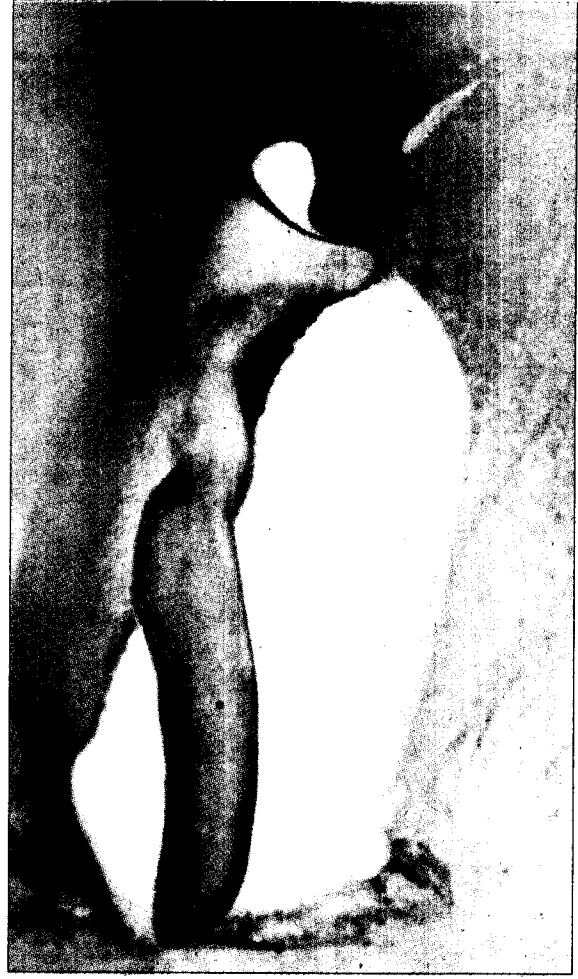
企鵝蛋，終於裂殼了。企鵝蛋終於出現裂痕，露出白白的薄殼。新聞見五版。