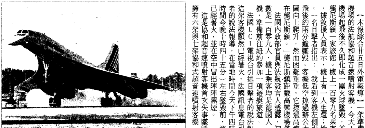
不復飛起機樂高戴黎巴自日五廿機客射噴和協航法架一 客乘名九零百一上機，館旅家一的郊近場機及撞，毀墜即久 。亡死人四有則上地。還生式蹟奇人一有，難難員人組機與 的機客和協為圖下。景情的煙濃陣陣出冒後地墜機客為圖上 (社聯美、社新法)

協和機巴黎墜毀 113人罹難 法航飛紐約班機起飛不久失事撞及旅館 機上一人生還 地面有四人死亡 【本報綜合廿五日外電報導】一架準備飛往紐約甘迺迪機場的法航協和超音速噴射客機，今天下午自巴黎戴高樂機場起飛後不久即化成一團火球墜毀，並撞及機場西南方聖尼爾鎮一家旅館。機上一百零九名乘客與機組人員罹難，據救援人員表示，機上有一人生還；地面則有四人死亡。 一名目擊者指出：「我看到客機左側引擎著火，並於起飛後約兩分鐘墜毀。客機低空掠過辦公大樓，機長顯然試圖向上爬升，然而困難重重。它掠過高速公路，最後墜毀在聖尼爾鎮。」聖尼爾鎮距離戴高樂機場僅幾公里。 法國內政部長與法航發言人透露，初步估計的罹難人數是一百零九人，機上乘客均是德國人，他們包下這架飛機，準備前往紐約參加一項遊艇旅遊。 法國L.C.電視台引述目擊者的說法報導，在墜毀前，這架客機顯然已經著火，法國訊息電台引述另外一名目擊者的說法報導，在當地時間今天下午四時四十五分（台北時間今晚十時四十五分）左右墜毀前，這架客機的發動機已經著火，並在空中冒出陣陣黑煙。 這是協和超音速噴射客機首次失事墜毀。法航與英航各擁有一架與七架協和式超音速噴射客機。相關新聞見五版