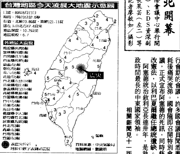
台灣地區今天凌晨大地震示震圖