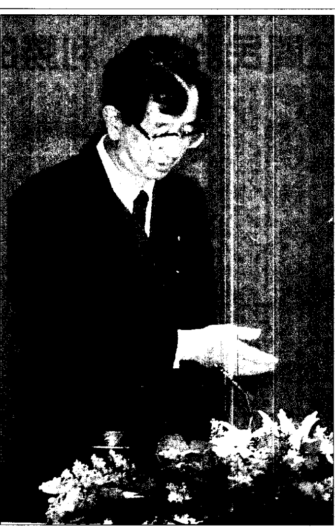
灣台薦推，度態示表未哲遠李，閣組推李進勸問顧政國，開召次首天昨議會問顧政國

【本報記者彭政、李彥甫／台北報導】總統當選人陳水扁的「國政顧問會」昨天召開第一次會議，陳水扁屬意的人選李遠哲在會中婉謝組閣，並推薦殷琪、施振榮及某政治人物列為人選。李遠哲在會中表示，他目前沒有意願出任閣員，但他會盡心為國家效力。他並推薦殷琪、施振榮及某政治人物列為人選。李遠哲在會中表示，他目前沒有意願出任閣員，但他會盡心為國家效力。他並推薦殷琪、施振榮及某政治人物列為人選。