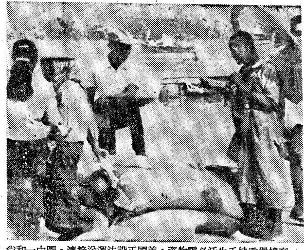
向和一中圖。濟接送運法設正國美，實物需必活生乏缺重嚴情高 • 米國美的到運近新包袋為者視注所

站察觀出退 【路透社西貢廿三日專電】波蘭督監人今日在寮戰俘營視察，隨即退出。波蘭督監人之視察，引起了各方之關注。波蘭督監人之退出，顯示了各方在寮戰俘問題上之分歧。