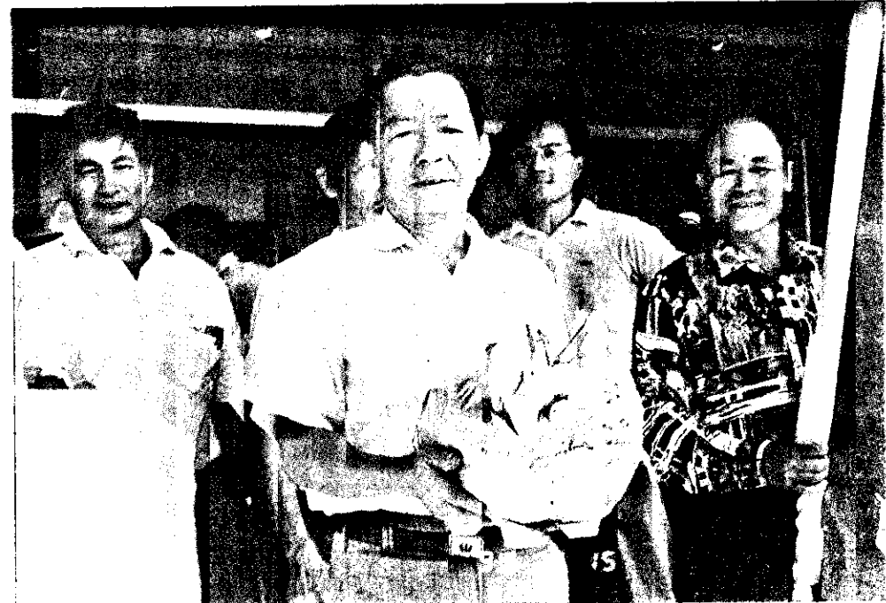
滿撲金 縣議抗，「滿撲金」的成作紙色持手人老的情陳。影攝/翁森林者記

【記者唐菁賜/后里報導】省自來水公司應允改善后里鄉自來水質，自新築的鯉魚潭水庫引水到后里，但延遲一個多月，吃無下文，引起后里鄉民不滿，圍堵鯉魚潭水庫，以表達抗議。 省自來水公司表示，埋管工程受到三豐路是否拓寬影響，一直無法進行，已與縣公所研商中。 台中縣后里鄉舊社、屯南、屯西、中和等村，長期以來一直受到鄰近三鄉市垃圾場汙染，有三百多名村民罹患皮膚病、肝病、哮喘等病；去年鯉魚潭水庫完工，除運送水外，水庫還可供應蔬菜、台中市等地區使用，但埋設的輸水管線經過后里鄉，卻無法給后里鄉使用，因此鄉民才向省自來水公司反映，盼能作適當回饋。 今年縣公所爭取後，省自來水公司答應在今年七月間供應可供飲用的自來水，給鄉民飲用，鄉民也認為在三鄉市垃圾場於今年六月底封場後，不必再遭受汙染之苦，但過了一個多月，迄今未見埋管。