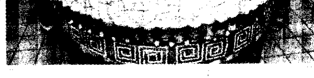
數名來自中國大陸廣東省的主廚，在台北展示了他們的「超級月餅」。

【本報記者】來自中國大陸廣東省的主廚，在台北展示了他們的「超級月餅」。這些月餅由多種材料製成，包括肉、蛋、海鮮等，味道豐富多樣。主廚表示，這些月餅是他們家鄉的傳統風味，希望能在台北也能受到大家的喜愛。