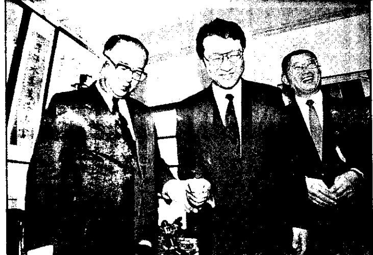
趙少康與省議員邱創良等，在壩中長里元萬卅人給瑜楚宋傳一事，表示其有確萬卅示表良創邱員議省，認否口矢席主省。

【記者胡玉立台北報導】省議員邱創良日前在省議會中，對省主席宋楚瑜在壩中長里元萬卅人給瑜楚宋傳一事，表示其有確萬卅示表良創邱員議省，認否口矢席主省。 據悉，省議員邱創良日前在省議會中，對省主席宋楚瑜在壩中長里元萬卅人給瑜楚宋傳一事，表示其有確萬卅示表良創邱員議省，認否口矢席主省。 據悉，省議員邱創良日前在省議會中，對省主席宋楚瑜在壩中長里元萬卅人給瑜楚宋傳一事，表示其有確萬卅示表良創邱員議省，認否口矢席主省。