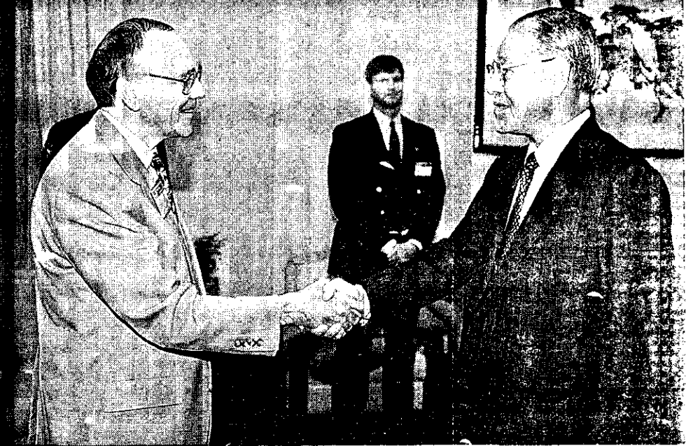
李總統與行政院長蔣經國在台北舉行會談，蔣院長對李總統的領導表示欽佩，並祝願中華民國在國際事務中取得更大的成就。

前據記者陳鳳鳴／台北報導：政府高層人士表示，政府目前正積極與中共進行談判，以期達成某種程度的諒解。然而，中共方面卻不斷挑釁，阻撓談判的進展。政府對此表示遺憾，並表示將採取必要措施，維護國家的主權與利益。 據悉，中共方面最近挑釁頻繁，包括在邊境地區進行軍事演習、挑釁性言論等。這些行為嚴重威脅了國家的安全與穩定。政府表示，如果中共不採取實際行動，停止挑釁，政府將不得不採取果斷措施，以維護國家的利益。 政府呼籲中共方面應正視問題，停止挑釁，回到談判桌前，共同尋求解決問題的辦法。否則，後果將不堪設想。