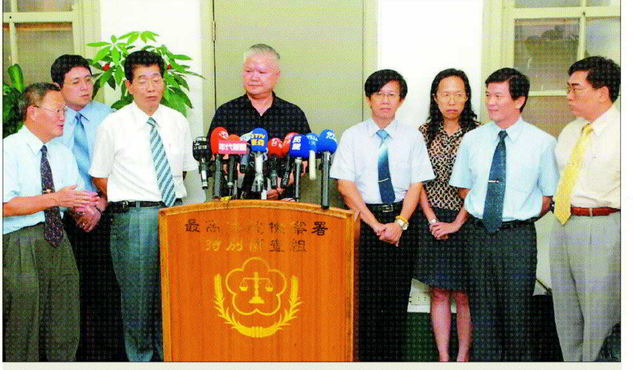
一字排開 宣示決心 特偵組全體檢察官昨天罕見的一字排開舉行記者會，宣示偵辦中的國務機要費案及扁家海外洗錢案，年底前可望偵查終結，給外界交代。檢察官表示，「案子如果辦不出來，願下台一鞠躬」，離開特偵組。