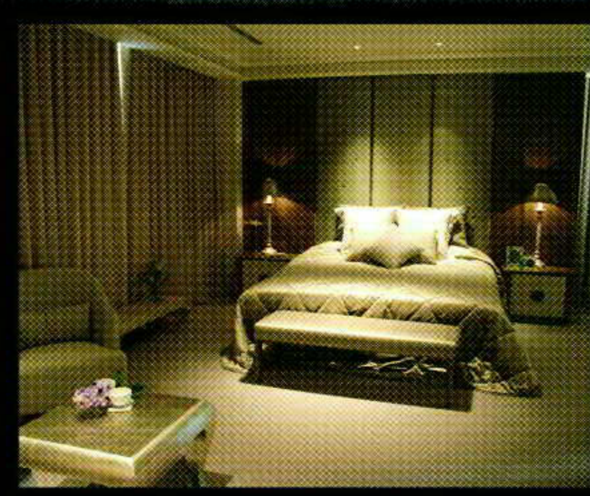
▶ KING SIZE 主臥房