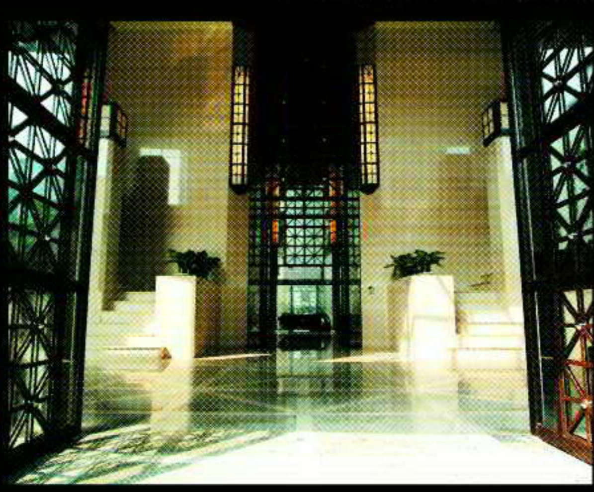
◀ 御之苑尊爵大廳實景