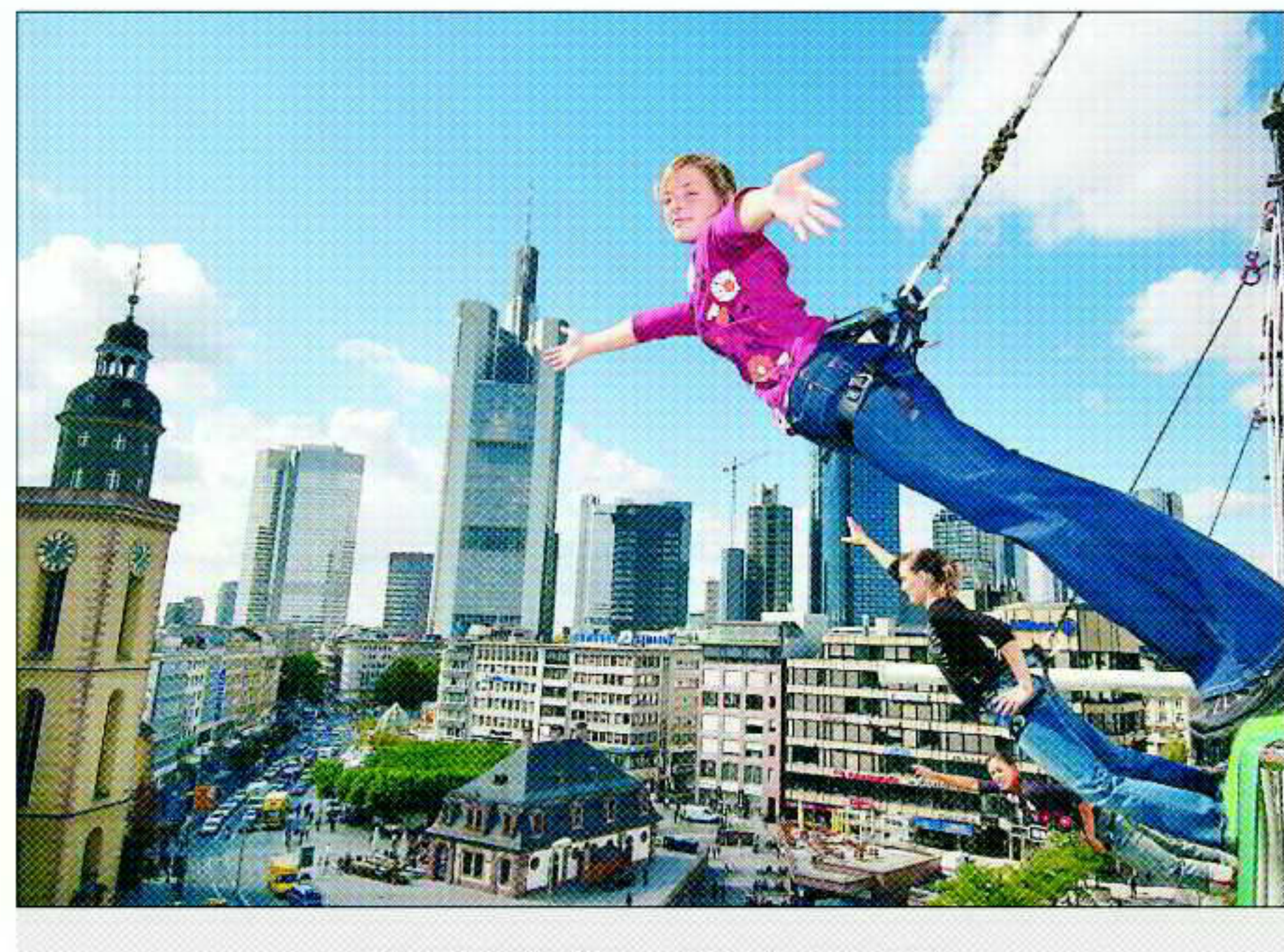
法蘭克福 空中走秀 三名模特兒十五日在德國法蘭克福一家商店前，於離地廿公尺的空中，別出心裁的「垂直」走秀。她們身上穿的都是新一季的流行服飾。

【編譯陳世欽/綜合報導】倫敦泰晤士報十五日報導，知名辛辣諷刺作家凱莉十四日推出新書《家族：布希王朝的真實故事》(The Family: The Real Story of the Bush Dynasty)，大爆美國總統布希在老布希總統任內，在大衛管吸食古柯鹼的內幕。 凱莉在書中指稱，布希在一九八六年四十七歲生日當天戒煙後吸煙，至於美國第一夫人蘿拉則曾在大學時期非法吸食大麻。俄和凱莉一次共進午餐時，一名出版商也在場，並表示凱莉的說法無誤。凱莉以四 年時間進行將近一千次訪談。她引述布希大學時期一名同窗的談話指出，他曾向布希出售古柯鹼。另一名布希的耶魯同窗透露，他曾和布希一起吸食古柯鹼。這些指稱似乎不會對尋求連任的布希造成太大的傷害。布希曾坦承，年輕時他曾吸食大麻。 凱莉並未提出有關布希在國民兵服役期間逃避年度體檢及被勒令停飛一事的新材料。她說：「沒有任何有力證據可以佐證布希曾因吸毒被勒令戒煙。」她甚至為布希 和吸毒的朋友，蘿拉並經常擔心布希是否夜不歸營。 凱莉指出，布希夫婦的婚姻關係會「起伏不定」，兩人很少在公開場合有親密的肢體語言，甚至很少手牽手。凱莉說：「事實上，兩人對彼此的關係表現甚至不如對他們的愛犬那麼露骨。」即愛布希入主白宮後，蘿拉仍繼續參加男性止步的年度旅行假期。 深受愛戴的老布希夫人芭芭拉也認為，凱莉的說法已使她的名譽受損。凱莉談到芭芭拉的時候說：「老布希夫人表面上賢良淑德，實則珠光寶氣。」 《家族》一書並未對美國國家安全、兩千年美國總統大選的佛羅里達州選票爭議，及布希家族與沙烏地阿拉伯的關係多所著墨。它相當大的篇幅談論布希家族的早期歷史，著重探討已故美國前總統雷根與連南和芭芭拉之間的關係。全書七百零五頁，卻只以不到七頁討論尚未完全落幕的伊拉克戰爭。