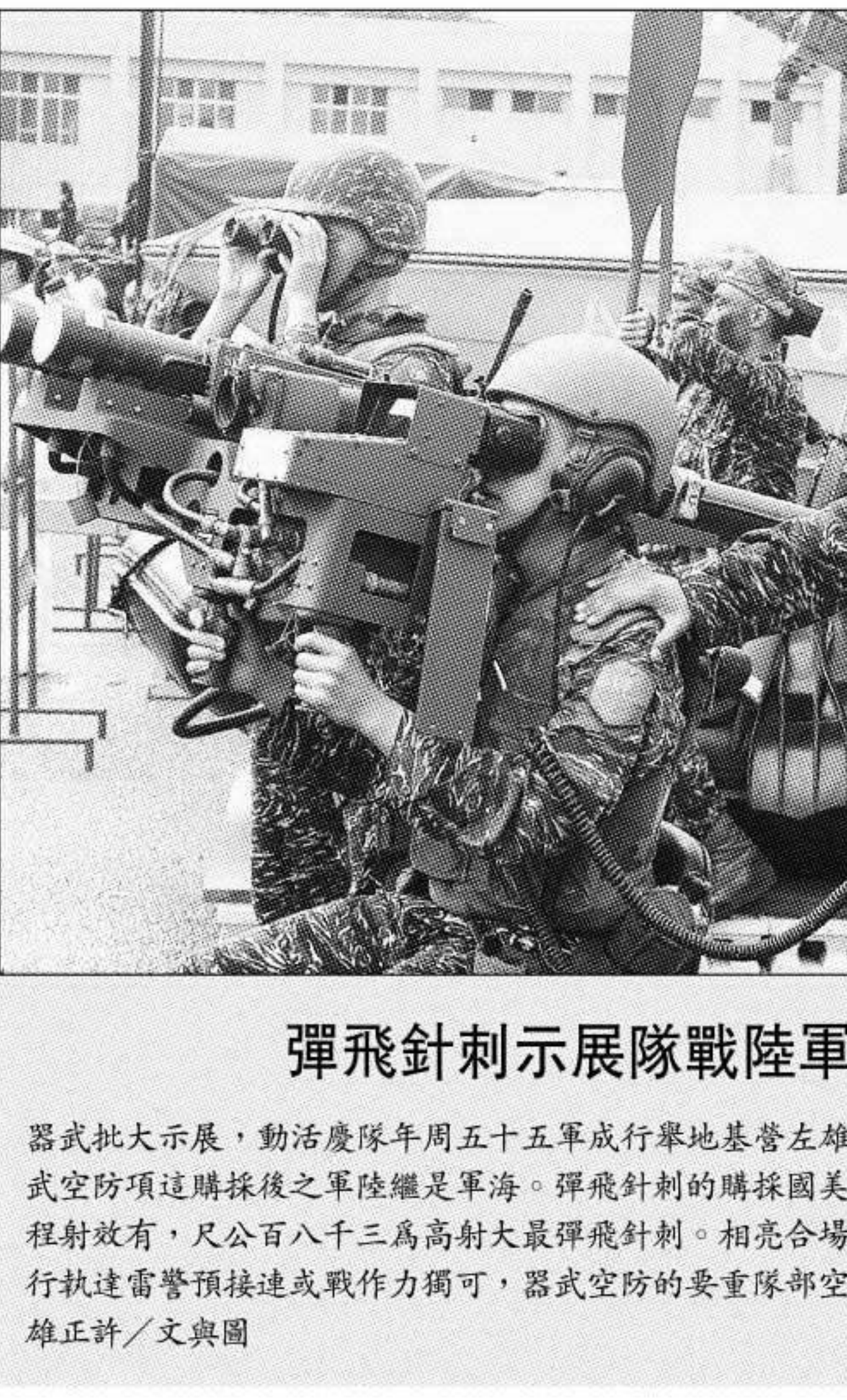
彈飛針刺示展隊戰陸軍海

【記者馬道容／台北報導】行政院研究會最近完成「總統交接條例草案」，做為我國政權移交的基本法。草案明定，從總統當選人名單公告日起，除立法院已通過的法律、預算及政府經常性支出外，凡未執行的爭議性政策、命令、國際條約、特別預算等均應凍結，但總統連任者不在此限。 研究會指出，訂定此一條例的目的，是為了保障正副總統當選人安全，並協助其以正副總統當選人身分就職前的準備，以利政務銜接和維繫國家安定。