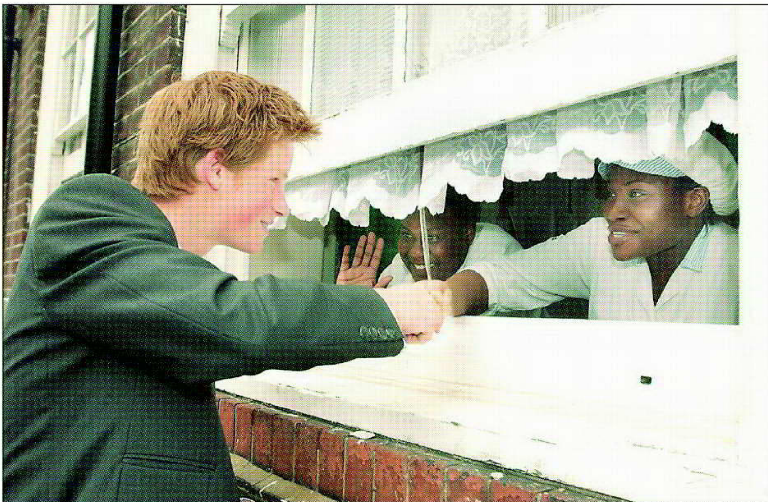
動活善慈個一加參前目他，歲八十滿日五十於利哈。話談工廚與校學所一敦倫在日二十利哈子王小國英。生衛的民人界世三第持支將能可

處境，說他是「備位而非繼位人」。但各報今天刊載專訪摘要及照片以慶祝哈利王子成年時，紛紛稱道他心智成熟，外貌英俊，並表示他終於找到自己已在王室的歸屬感。 在專訪中，哈利王子顯得自信十足。與之前對他的報導有天壤之別。 在專訪中，被問到元月間坦承吸大麻及十六歲便飲酒一事，哈利王子答稱：「那是一個錯誤，而我也學到教訓了；我從來就無意成爲那個樣子。」他說，受到亡母樹立的榜樣啟發，他將把出售泰斯提諾爲他拍攝的一系列七張相片所得，捐給一個資助開發中國家醫療工作的小型慈善機構。