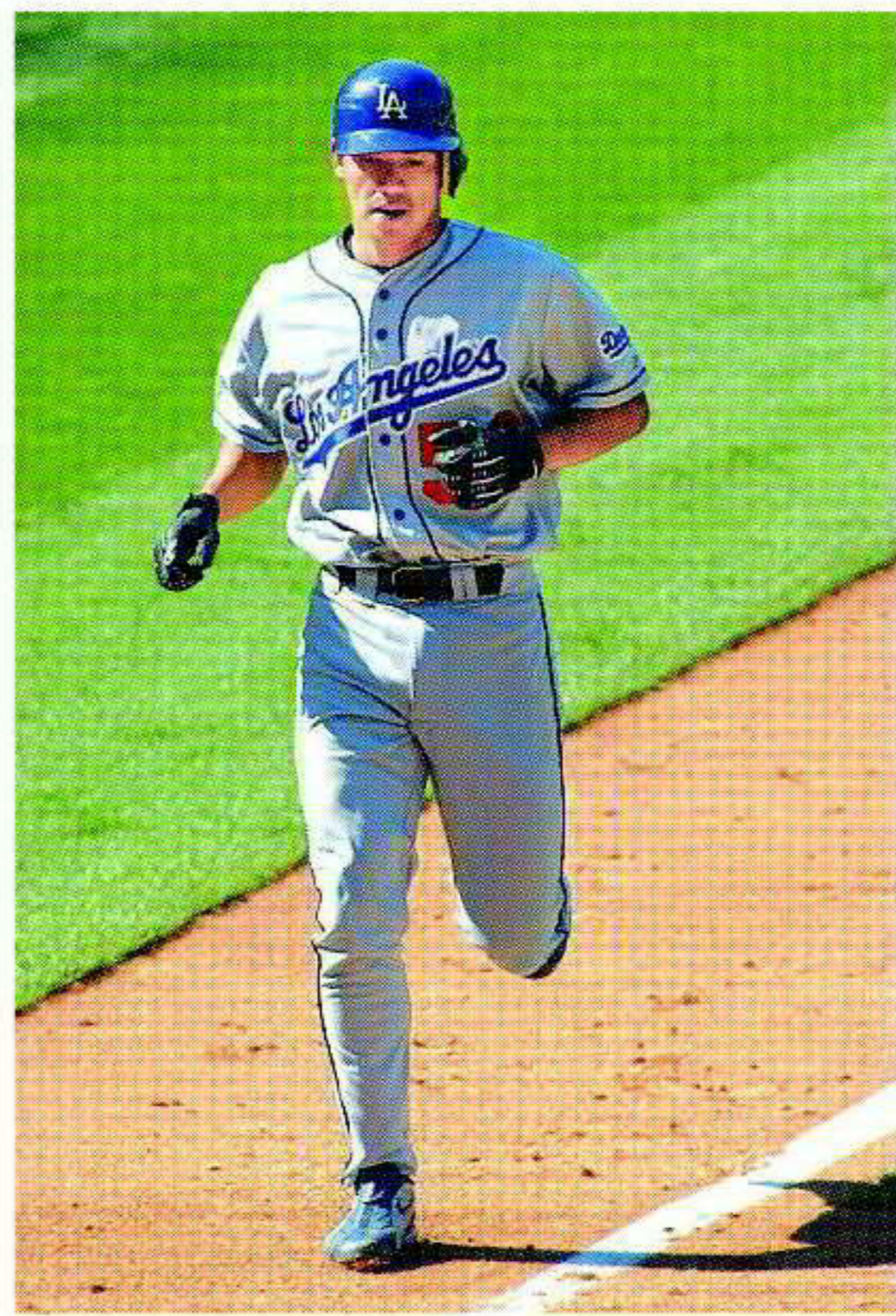
在隊友打回本壘後，陳金鋒在場上慶祝。昨天他擊出全壘打，幫助洛杉磯道奇隊以六比零擊敗聖路易紅雀隊。