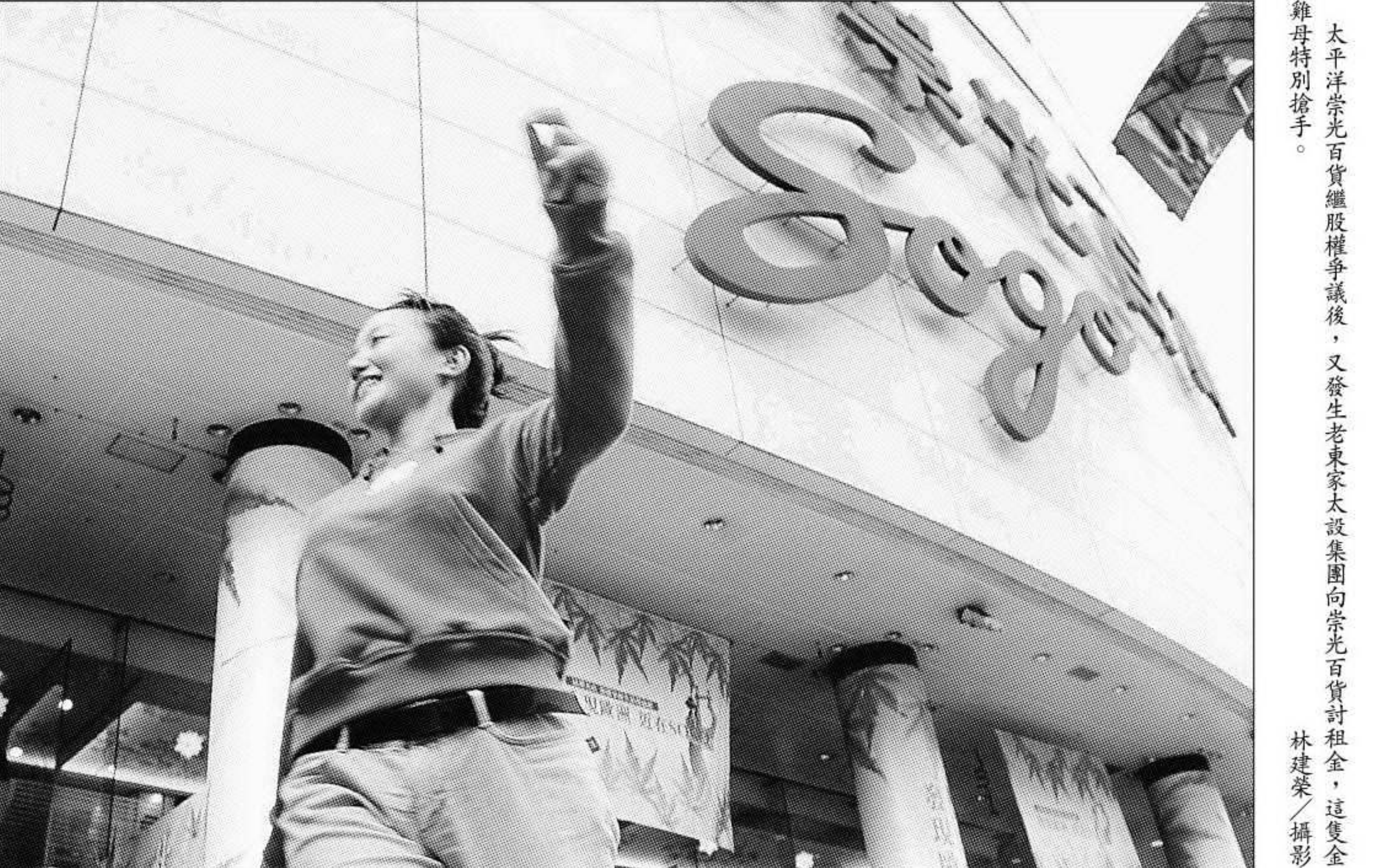
太平洋光百貨繼股權爭執後，又發生老東家大設集團向光百貨討租金，這隻金雞母特別搶手。

【記者羅兩沙／台北報導】據指出，大設集團旗下的太平洋建設等企業在銀行間的貸款，已出現二個月未繳息的情況；同時，太平洋建設公司有一筆由合作金庫銀行保證的貸款，將於九月到期，該公司目前正與債權銀行進行協商，以爭取展期一個月，以紓緩該銀行的財務壓力。 債權銀行主管透露，事實上目前大設集團在銀行的貸款利率已降至百分之六，且過去的貸款，已出現二個月未繳息的情況；同時，太平洋建設公司有一筆由合作金庫銀行保證的貸款，將於九月到期，該公司目前正與債權銀行進行協商，以爭取展期一個月，以紓緩該銀行的財務壓力。 債權銀行主管指出，大設集團在銀行間的貸款金額合計高達四百億元，目前除除下的「忠孝水電工程公司」外，其餘包括太平洋建設公司等，其餘包括太平洋建設公司等，其餘包括太平洋建設公司等。