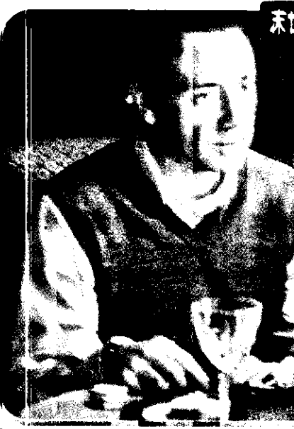
凱文史皮西在「美國心、玫瑰情」中的演出頻頻得獎。