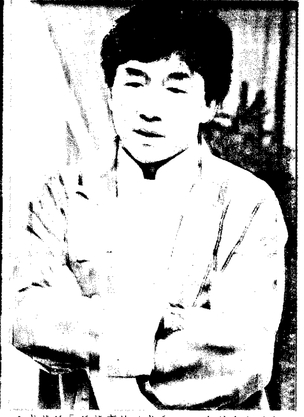
成龍的「種龍事件」成為1999年最轟動的大事。