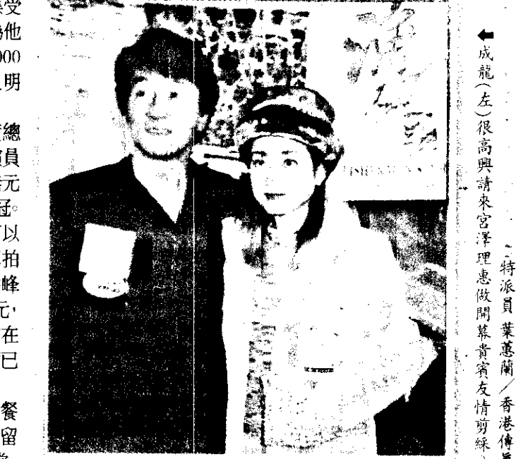
成龍(左)很高興與請來港理惠做開幕剪綵嘉賓友朋剪綵。

最近愛上溜冰刀(roller blade)運動的里惠健康情況已好轉，不少人都讚她更漂亮了。她笑稱，前天在港吃了很多魚翅和燕窩，問她有沒有拍拖？她又是笑著說：「你們猜看看。」有人說她那麼漂亮，一定有拍拖，她竟然回應道：「請你介紹男朋友給我。」