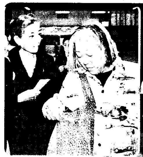
光子媽媽(右)保護女兒宮澤理惠無微不至。

記者 于欣巧 / 中正機場報導 ★宮澤理惠對於自己擔任金馬獎重要的獎項「最佳影片」的頒獎人，感覺是「很高興」！不僅如此，理惠還事先看了主辦單位寄來的金馬獎頒獎典禮錄影帶，對於今天做一個稱職的頒獎人很有信心。 理惠與媽媽光子、助理一行三人下午四點半左右抵達中正機場，睽違台灣六年，理惠雖然明顯瘦了許多，她的濃眉大眼和美麗卻是一點也沒改變。沒有心理準備在機場接受訪問的理惠，在短暫拍照時間過後，就以「超快速」的腳步拉著行李奔往出口。 雖然一路理惠表示不願意接受訪問，但是只要記者一發問她必定回答，連機場裡出現影迷要求簽名她也樂意為之。被問及此行來台有什麼計劃時，她表示由於來台時間短暫，即使想要