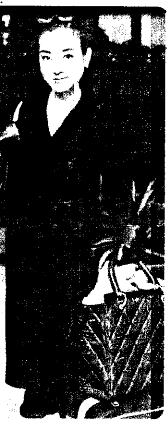
問候本報讀者。 宮澤理惠惠茶名