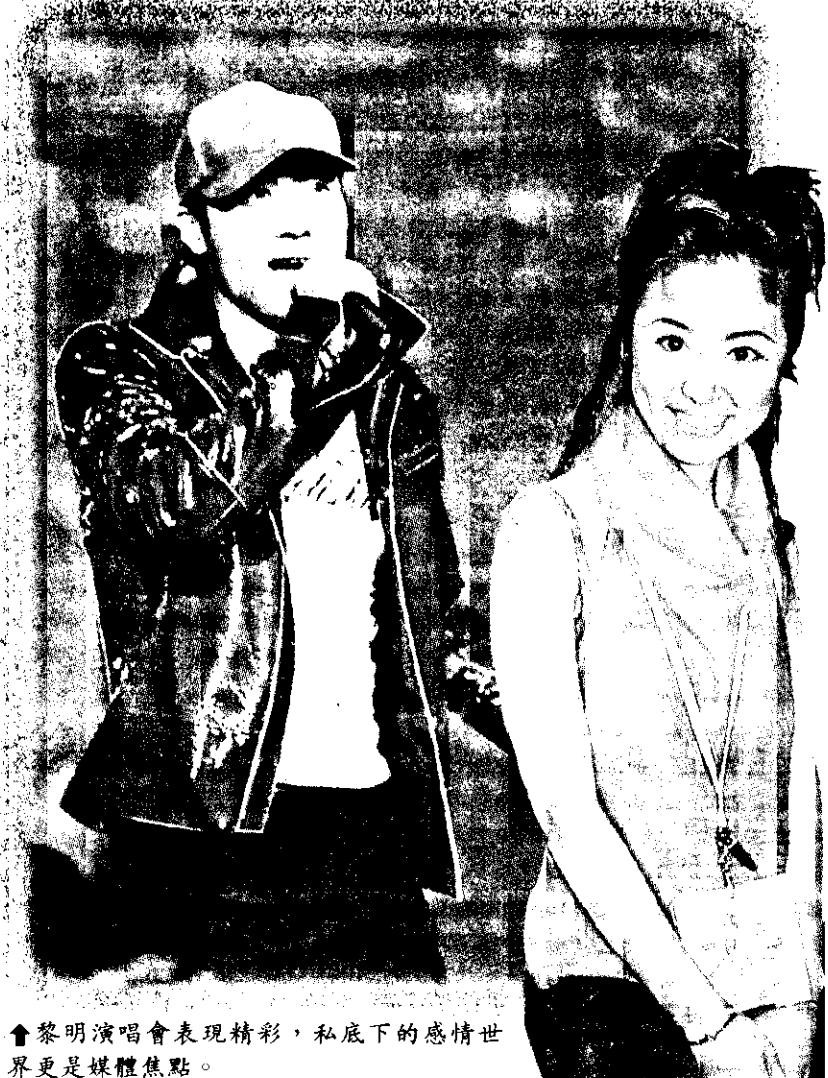
▲黎明演唱會表現精彩，私底下的感情世界更是媒體焦點。