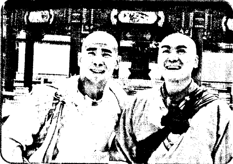
「范曉萱終於推出新專輯」我要我們在一起」