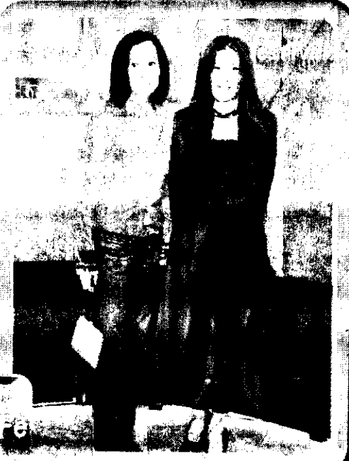
劉若英(左)和蘇慧倫二大美女出席台北電影節頒獎典禮。