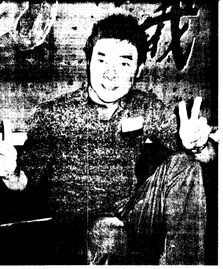
許志安舉起雙 V 手勢，暗示愛情事業均如意。