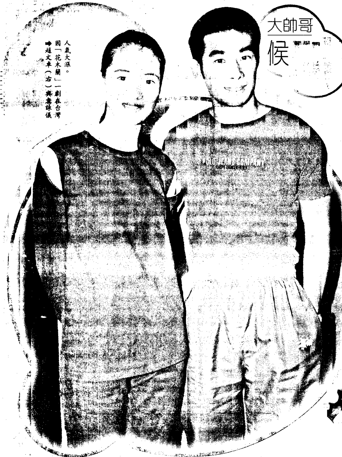
人氣大漲。因「花木蘭」一劇在臺灣引起文壇(右)與藝壇風暴。