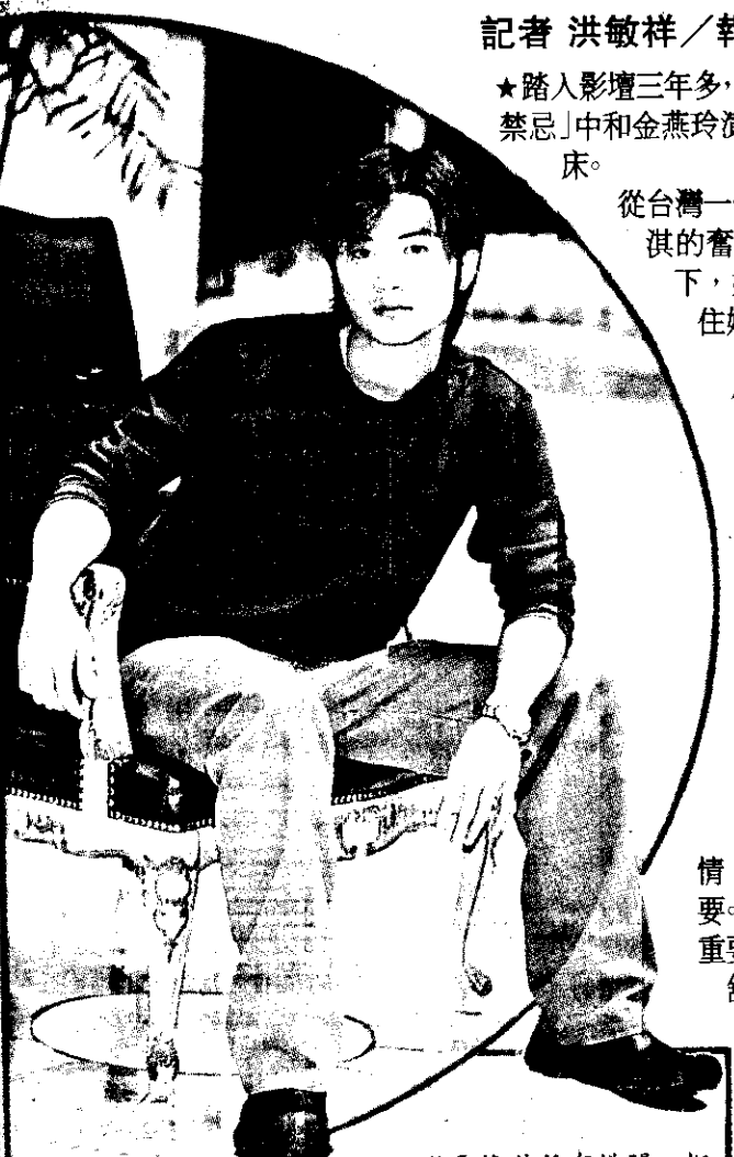
謝霆鋒對所有緋聞一概否認。